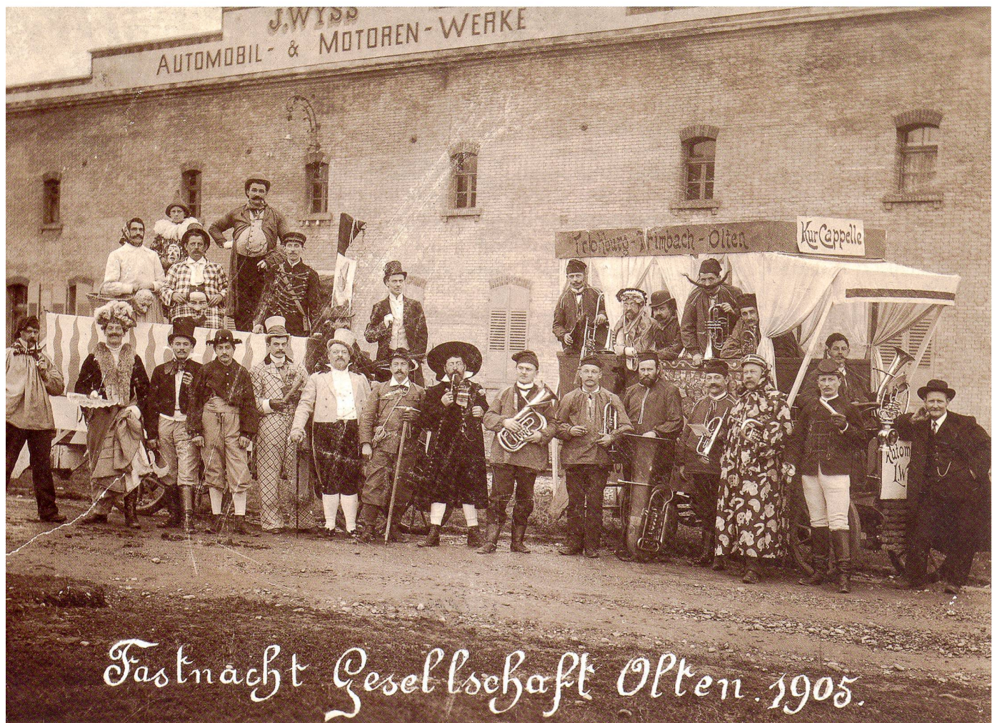
Fasnachtsgesellschaft 1905 vor der Automobilfabrik «Berna»

stand, ist nur ausnahmsweise zu eruieren. Ausgangspunkt der Maskenzüge scheint die Bierbrauerei Trog an der Aarburgerstrasse gewesen zu sein. Einen ersten Höhepunkt in der Geschichte der Oltner Fasnacht bildete das Jahr 1866. Der Spektakel vom Dienstag, 13. Februar, wurde von Arbeitern der Centralbahnwerkstätte organisiert. Eine in wenigen Tagen zusammengestellte «türkische Festmusik», bestehend aus 14 Mann, eröffnete um halb zwei Uhr den Maskenzug. Ihnen folgte, auf einem Wagen, eine Runde von Geisterbeschwörern und «Tischrückern.» Die spiritistischen Praktiken, welche dadurch aufs Korn genommen wurden, hatten sich damals, von Amerika ausgehend, zu einem beliebten und auch gefürchteten Gesellschaftsspiel entwickelt. 10 Die «Prügelei Ryniker samt Gaudium», die auf einem nächsten Wagen dargeboten wurde, nahm Bezug auf die Debatte über die Prügelstrafe, die damals auch das eidgenössische Parlament beschäftigte. 11 Danach folgten noch «einige andere Stücke, tragisch-komisch und handgreifliche Szenen aus der Neuzeit».