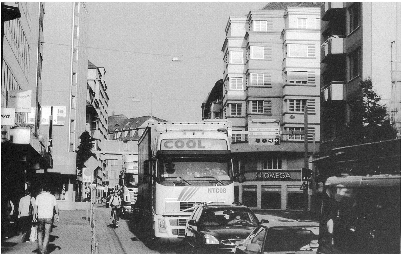
Rush hour an der City-Kreuzung

Gleich nach der 1883 errichteten neuen Bahnhofbrücke wurde die tief eingeschnittene Aare beidseits mit Repräsentationsbauten gesäumt, rechtsufrig mit einem Postgebäude, später einem Hotel, und auf der gegenüberliegenden linken Aareseite, mit dem eindrucklichen Komplex Amt-