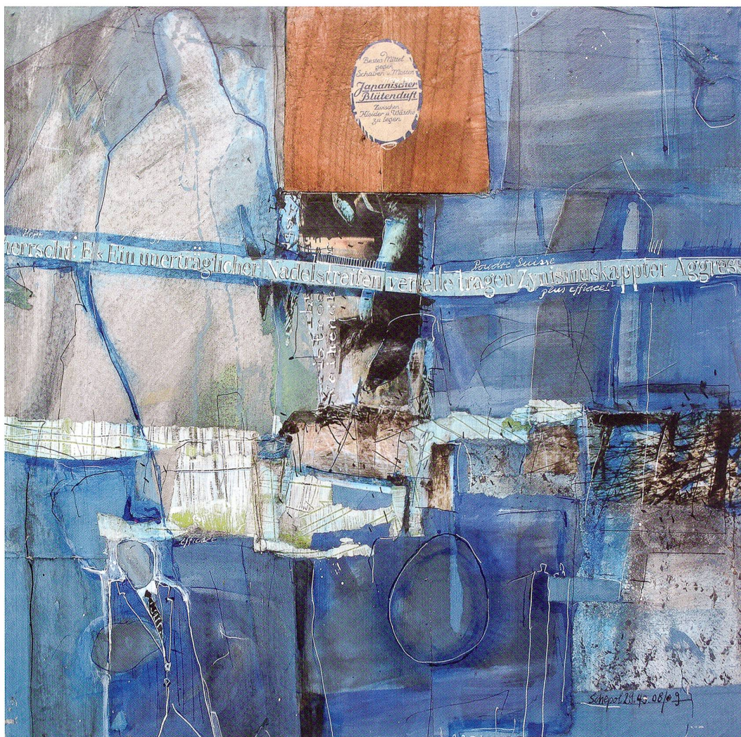
«Nadelstreifen und japanischer Blütenduft». Rahmenlose bearbeitete Collage, Kirschbaumholz auf MDF Platte, 2008/2009, 50 x 50 cm

hoch, teils mit beweglichen Teilen, aus verschiedenen Materialien, geprägt und bestückt nicht nur mit unerwarteten Fundgegenständen, die eine neue Funktion erhalten, sondern auch Gemaltes und Bedrucktes kommen zum Tragen. Diese Objekte erzählen von einer Welt, die nicht nur mit realen Dingen und Funktionen spielt, sondern auch surreale Betonungen und Abläufe zelebriert, so als müsste man immer wieder von Neuem beweisen, dass die Dinge nie so sind, wie man sie erwartet, sondern immer anders und vielschichtiger, weil jeder Atemzug in sich ein Stück Veränderung trägt und Neues oft aus Bestehendem realisiert wird. Seine Objekte sind nicht nur perfekt geschaffen, ästhetisch, voller Schönheit, sondern sie erzählen auch eine besondere Geschichte. Man kann sich an ihnen kaum satt sehen, geniesst diese originellen Kombinationen, diese ausgefallenen Formen und Zusammensetzungen. Im Dreidimensionalen ist der Künstler im Schaffen von noch grösserer Freiheit geprägt, hier kann er auch ausgefallene Ideen ausleben, originelle Entwicklungen zelebrieren und für sich Dinge ausklügeln, die ihn selbst überraschen, wenn sie ihre endgültige Gestalt angenommen haben, in der Übereinstimmung von Form, Farbe und Bedeutung.