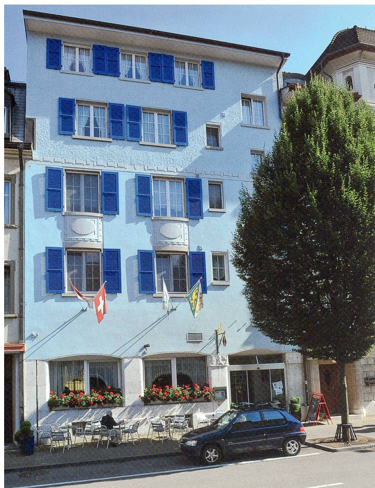
Das zweite Kolpinghaus an der Ringstrasse 27, heute das Restaurant «Kolpinghaus»

1968 teilte die Kirchgemeinde dem Gesellenverein mit, dass sie das alte Pfarrhaus in ein Pfarreijugendzentrum umbauen wolle, und der Gesellenverein mit der Kündi-