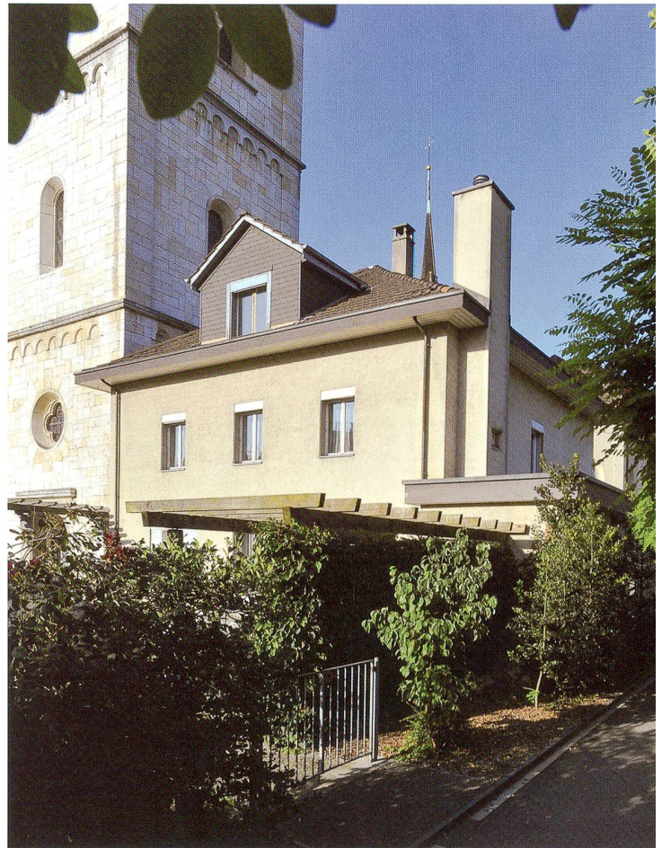
Erstes Gesellenhaus in Olten war das alte Pfarrhaus an der Ringstrasse 25, das heutige Pfarrei-Jugendzentrum.

1925 wurde dem Oltner Gesellenverein das alte Pfarrhaus an der Ringstrasse 25 zur Miete angeboten. Es enthielt ein Vereinslokal, eine 2-Zimmer-Wohnung für den Hausmeister, 4 Zimmer für Gesellen und ein Zimmer für den