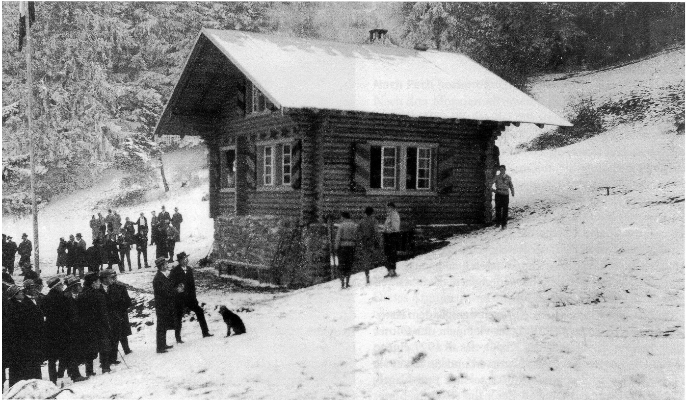
Einweihung der Bergli-Hütte am 29. Januar 1933

siert. Aber alle waren motiviert. Doch sie haben es geschafft. Hier beginnt eigentlich die unglaubliche Geschichte. Was Barack Obama im Wahlkampf oft in die Runde rief, haben vor ihm die Blauen aus Olten längst gekannt: Yes, we can.