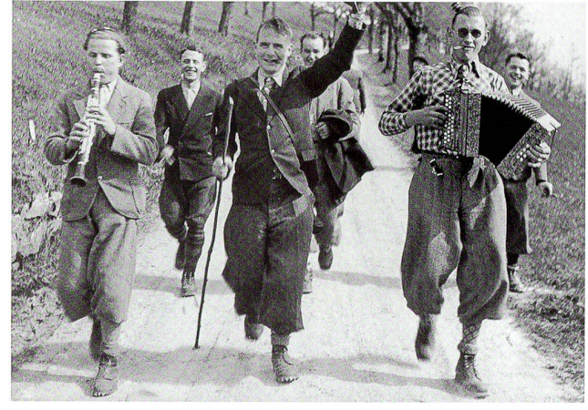
Wandern im Jura 1939

Die Hütte war gebaut. Am 29. Januar 1933 wurde sie feierlich eingeweiht. Der Betrieb konnte aufgenommen werden. Die Blauen liessen auch weitere Kreise an diesem Kleinod auf der Buchster Weide teilhaben. Privaten und Vereinen wurde sie zu günstigen Bedingungen zur Verfügung gestellt. Daran hat sich bis auf den heutigen Tag nichts geändert.