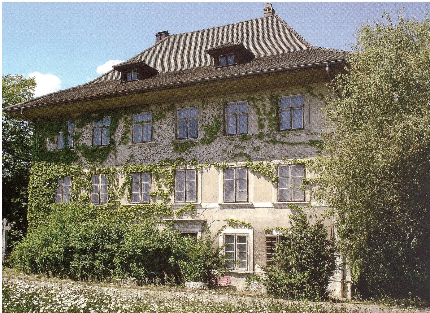
Die Südansicht der Mühle Rickenbach, wie sie sich heute präsentiert.