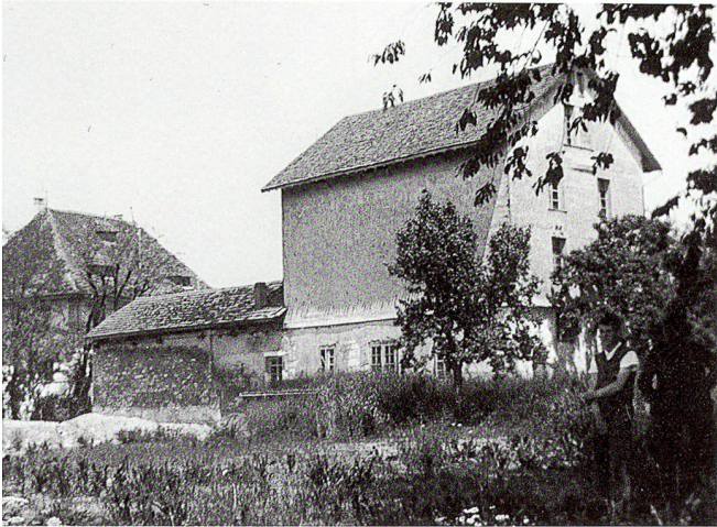
Zwei historische Ansichten von Süden und Südwesten