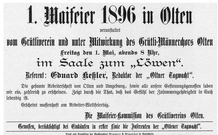
Oltner Tagwacht 1897.10.06. (oben) und 1896.04.30. (unten)