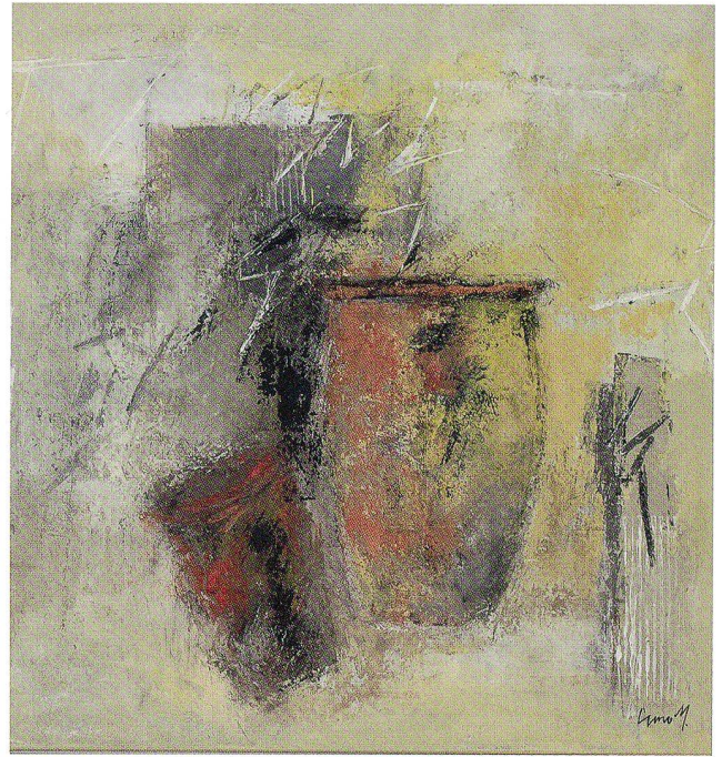
Gesehen – geblieben!, Acryl auf Leinwand, 2007, 88 x 88 cm

Erklärung, man darf sie nach Lust aufleben lassen, mit ihnen spielen und variieren, und immer wieder entsteht etwas Neues, das beflügelt. Fesselnd sind seine neuen grosszügigen abstrakten Bildräume in differenzierten, lebhaften Farbkombinationen, die den Betrachter auf Antrieb begeistern. Durch die schwungvolle Pinsel-führung erkennt man ein Farbenspiel, das emotional bewegt und auch Rätsel aufgibt. Blaue Bildräume, durchzogen von Grau und milchigem Weiss, strahlen träumerische Ruhe aus. Sandtöne, aufgehellert von farbigen Schimmern, erzählen von der Heiterkeit südlichen Lebens und auch das Dunkle und Verhangene einer Graukomposition ist voller liebenswerter Melancholie. Manchmal wünschte er sich, dass er dynamischer, spontaner an seine Arbeit gehen könnte und nicht so kritisch sich selbst gegenüber stünde. Seine unruhige Suche nach Neuem ist unendlich; er weiss, dass nichts in sich abgeschlossen ist, dass man immer unterwegs ist und die Suche nach der gültigen Ausdrucksform unendlich bleibt. Das Malen ist ein Vorgang, der sich in sich selbstständig verändert, und dessen ist sich Cuno Müller in fast schmerzlicher Erkenntnis bewusst.