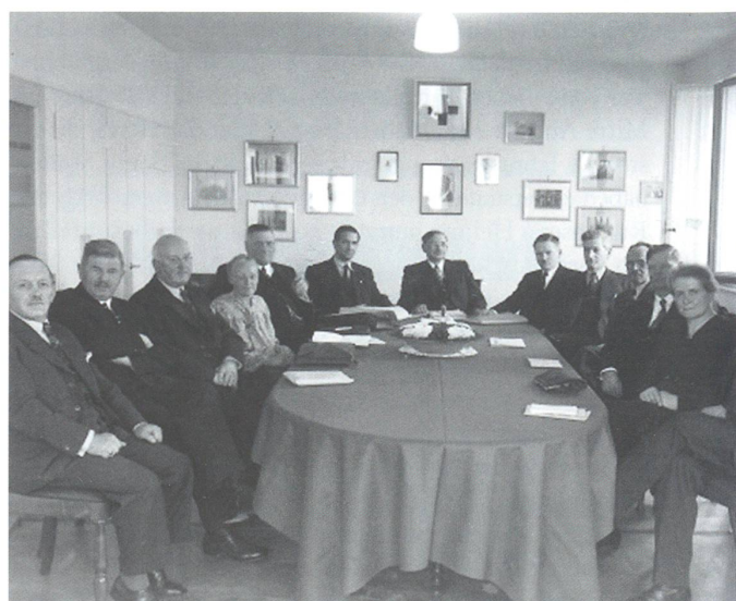
Die erste Sitzung im eigenen Domizil 1938

Dem starken Wachstum entsprechend vermehrten sich die Geschäfte, die von den ehrenamtlichen Mitgliedern der Leitungssektion Olten zu bewältigen waren. Deshalb beschloss die schweizerische Abgeordnetenversammlung