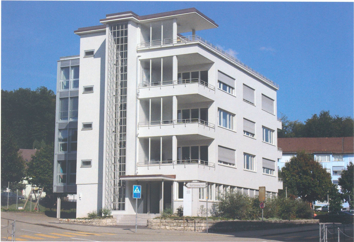
Das renovierte Gebäude des Samariterbundes 2012