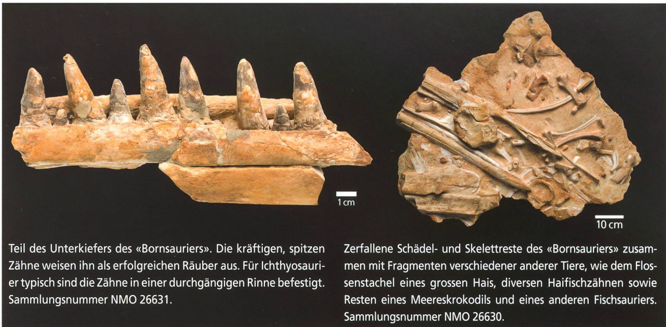
Teil des Unterkiefers des «Bornsauriers». Die kräftigen, spitzen Zähne weisen ihn als erfolgreichen Räuber aus. Für Ichthyosaurier typisch sind die Zähne in einer durchgängigen Rinne befestigt. Sammlungsnummer NMO 26631.