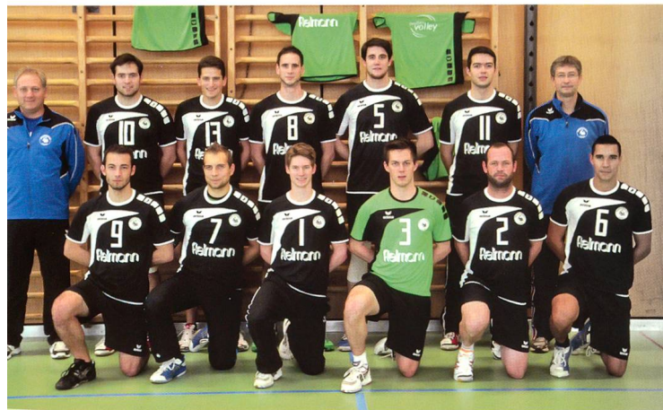
Die Volleyballer des SV Olten

wieder. Zusammen mit der zweiten Mannschaft duellierte man sich um die zwei Playoffplätze. Aufgrund von Rückzügen stiegen schliesslich beide Teams auf, und Olten hat damit ein neues Nationalligatteam und bestreitet seine Spiele in der laufenden Saison in der NLB.