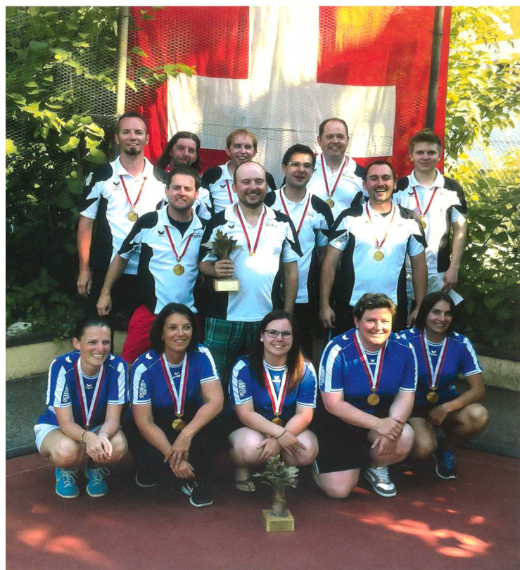
Minigolf Club Olten

Der Minigolf Club Olten feierte den grössten Erfolg seiner Vereinsgeschichte. Am Final-Spieltag der Nationalliga A in Gerlafingen sicherte sich das MCO Männerteam zum sechsten Mal in Serie den Meistertitel, das MCO Frauenteam holte nach Silber im Vorjahr zum ersten Mal die Goldmedaille. Die Qualifikation beider Teams für den Europacup nutzten die Damen zusätzlich mit einem zweiten Platz auf europäischem Niveau.