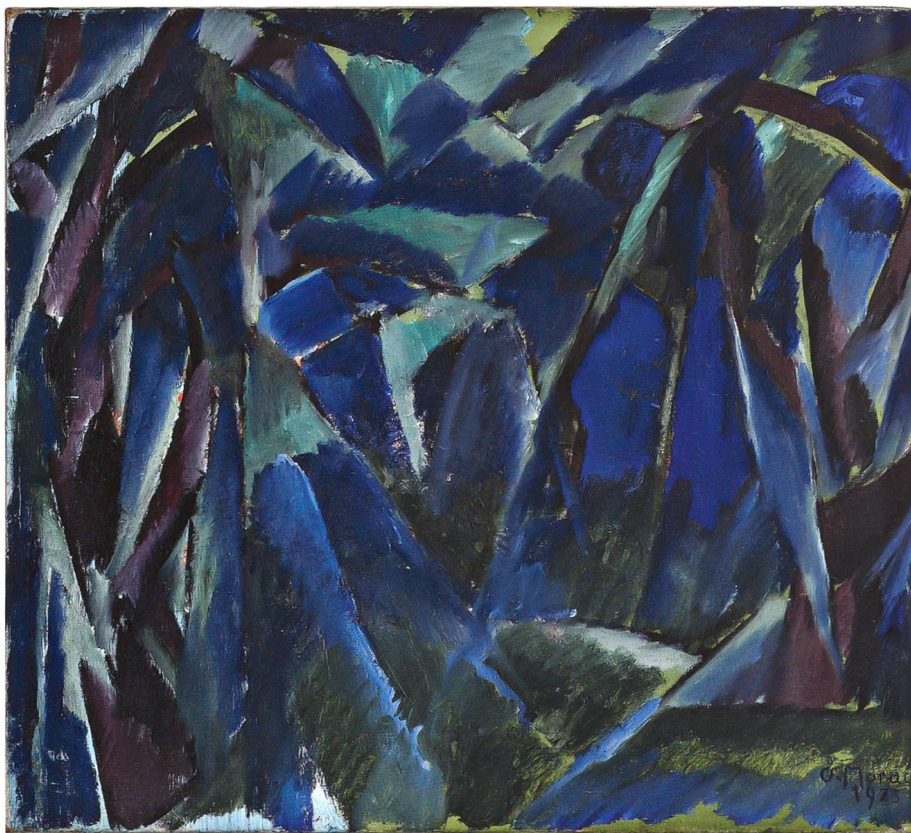
Dunkle Gebirgslandschaft, 1913-1914, Öl auf Leinwand, 46 x 55 cm