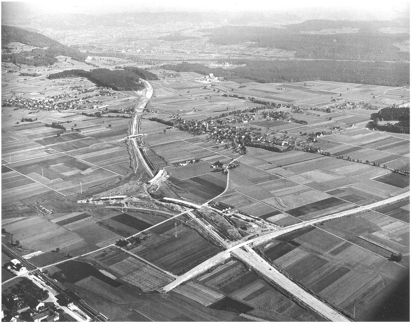
Die Autobahn A1 bei Härkingen im Bau

der Vision angesprochene Ikone lieferte dafür eine alte städtebauliche Utopie im Rang eines der (zahlreichen) sieben Weltwunder: die legendären hängenden Gärten der orientalischen Herrscherin Semiramis. Die Konzeption unterschiedlicher und nutzungsgetrennter städtischer Niveaus blieb städtebaulich virulent und vielerorts – leider oft zur rein funktionalen Massnahme degradiert – zur städtischen Realität.