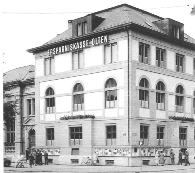
Das Gebäude der ehemalige Ersparniskasse Olten 1920 (oben) und 1960 (unten)

Bekannt ist aus der Fotosammlung Rubin und der Ausstellung der Oltnen Stadtbilder 2009 des Historischen Museums das Beispiel des linksseitigen Aareprospekts und hierin der Konzert- und Verwaltungsbau der vormaligen Ersparniskasse Olten nach Plänen des Malers und Architekten Gottfried Julius Kunkler, einem Schüler von Gottfried Semper (Semperoper Dresden, ETH Zürich). Der Vergleich der Zustände von 1920 und 1960 zeigt eine beispiellose und unentschuld bare Zerstörung eines historischen, stimmigen Ensembles. Rechtfertigend kann hier immerhin von einer bewussten, zeittypischen Gesamtintervention im Sinne einer stilistischen Adaption ausgegangen werden; trotzdem eine, zumindest aus der zeitlichen Distanz, nicht anders als missraten und dekadent zu bezeichnende Gesamtmassnahme.