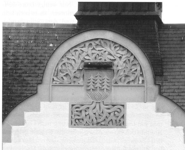
Die Giebelwandabschlüsse des Froheimschulhauses in der ursprünglichen Form und der heutige Zustand (unten)