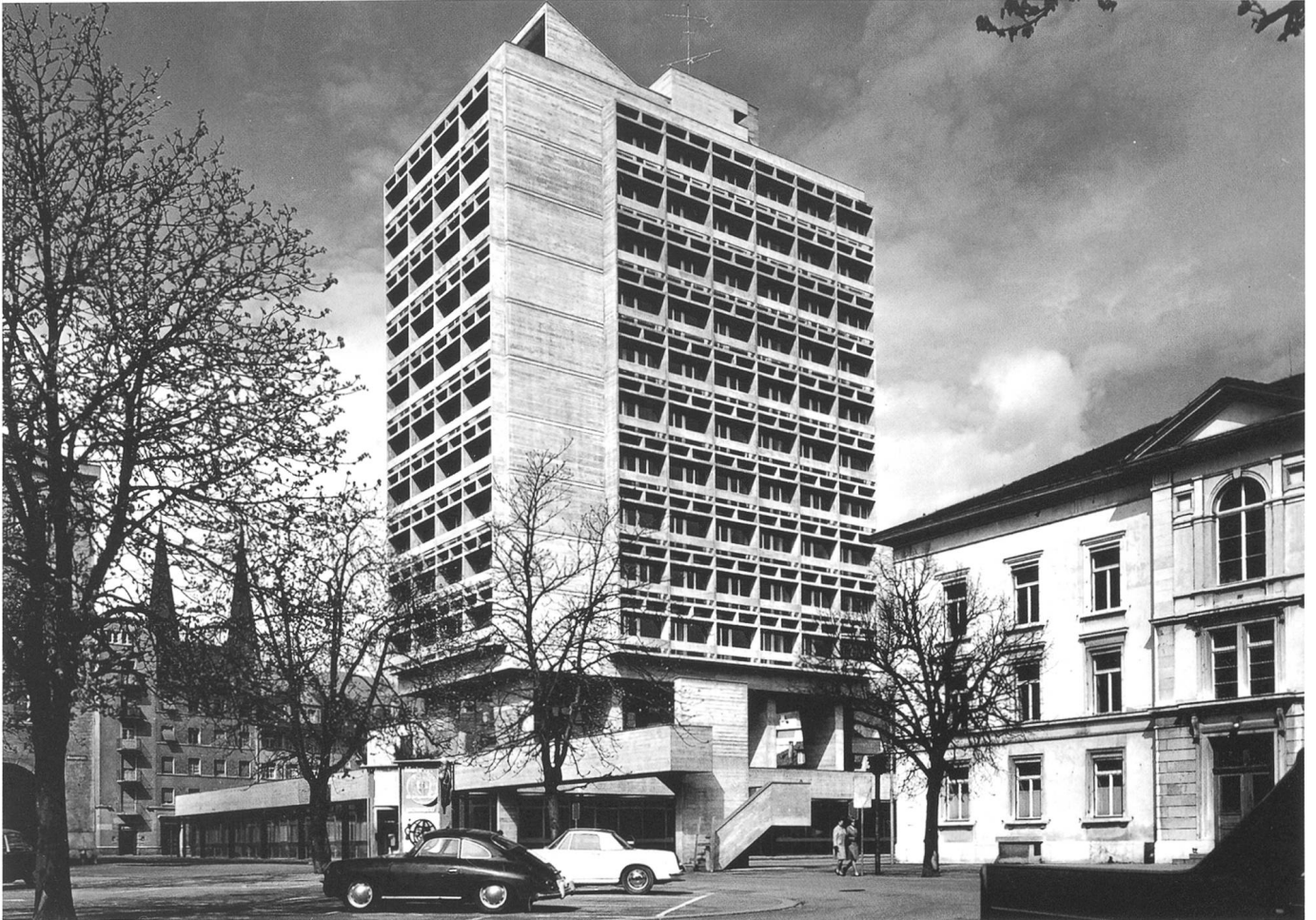
Das von 1962 bis 1965 erbaute Stadthaus Olten

Den Giebel des Mittelrisaliten des an der Schwelle zum 20. Jahrhundert erbauten Frohheimschulhauses ziert ein allegorisch erweitertes Emblem der Stadt Olten. Gleich einem Schnitt durch die drei Wappenhügel von Olten zeigt sich, wovon die Stadt zehrt: Ein reiches Wurzelwerk dringt in das Giebelfeld der Schule und im übertragenen Sinn in die Erfahrung und Weisheit, die durch diese Institution vermittelt werden. Darüber entwickelt sich ein reich, verzweigtes Geäst (siehe dazu S.53).