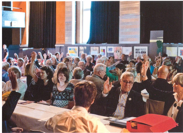
Jubiläumsgeneralversammlung, 23. Mai 2014 in der «Schützi»