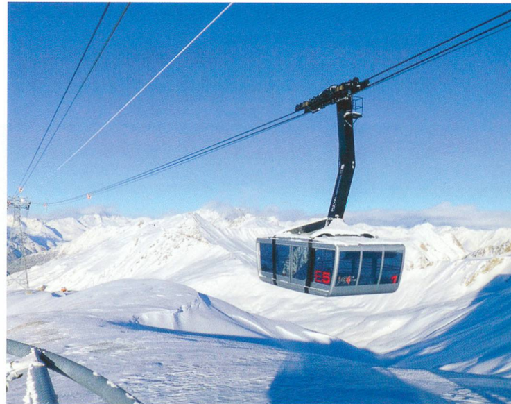
Piz Val Gronda, Oesterreich