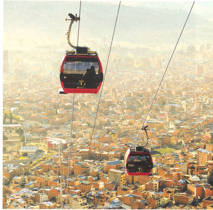
La Paz, Bolivien