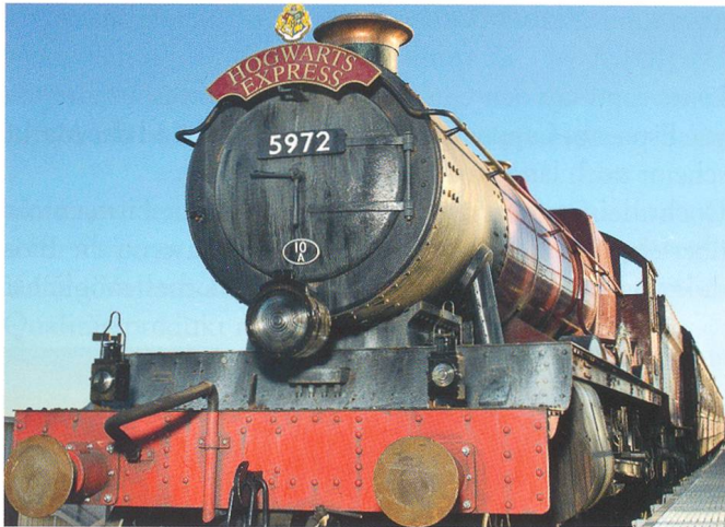
Hogwarts Express, Universal Studios Orlando, USA

nen Anforderungen gerecht und haben am Markt den unerreichten Standard für Kabinen im Bereich Einseilumlaufbahnen gesetzt. Parallel zum 75-Jahr Firmenjubiläum darf CWA im 2014 auch da 30-Jahr Jubiläum der Erfolgskabine OMEGA feiern.