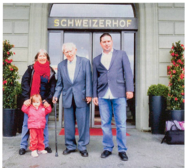
Vier Generationen vor dem Hotel Schweizerhof am 15. Mai 2014