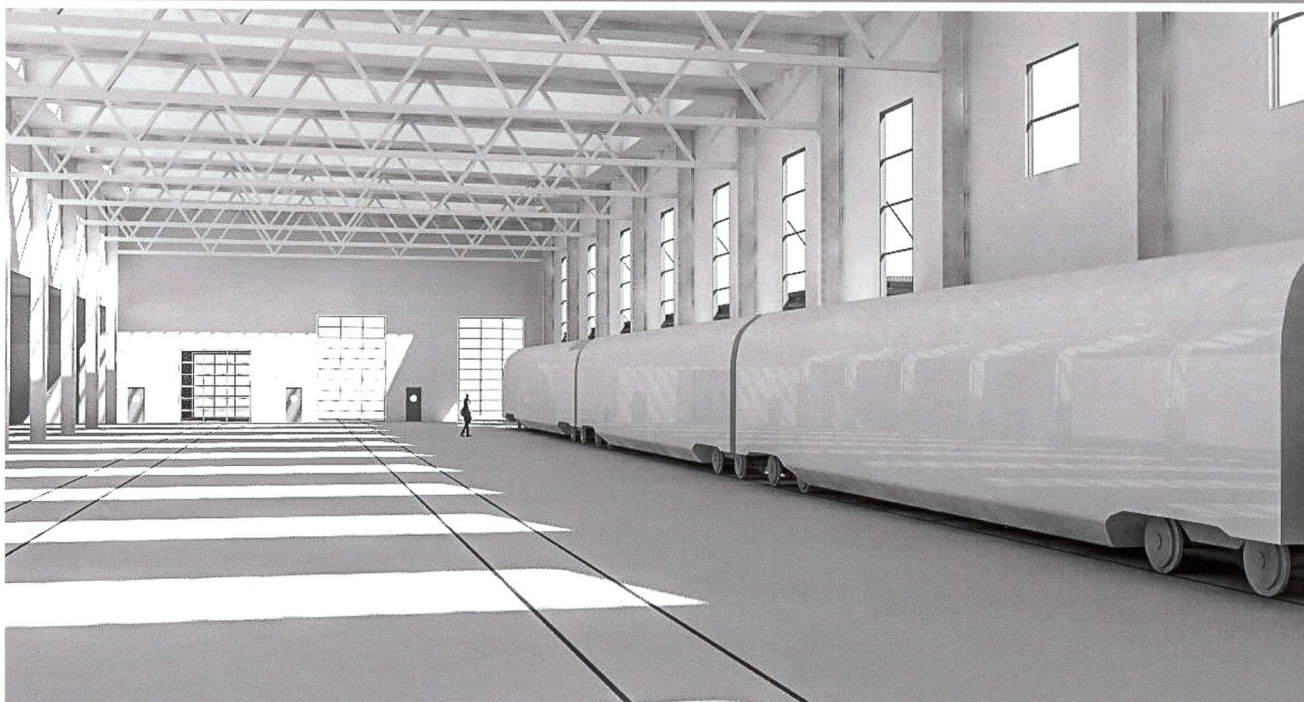
Im SBB-Werk Olten wird eine Halle mit Investitionen von rund 37 Mio. Franken angepasst, damit dort bis zu 150 Meter lange Trieb- und Gliederzüge gewartet werden können.

Baumann& Cie. eine Filiale. Im gleichen Monat verlegte der Schweizerische Handball-Verband seinen Sitz mit 15 Mitarbeitenden aus dem Haus des Sports in Ittigen bei Bern an die Tannwaldstrasse; gleichenorts zog auch die bisher in Bern domizilierte Stiftung Idée Suisse mit ebenfalls 15 Mitarbeitenden ein. Von Dietikon nach Olten kam der Verband Schweizerische Zentrale Fenster und Fassaden mit 18 Beschäftigten. Ein wichtiger Arbeitgeber in der Region, die Migros Verteilbetrieb Neuendorf AG, konnte zum Jahreswechsel ihr für über 67 Mio. Franken realisiertes Logistik Center Ost für Non-Food- und Fachmarkt-Artikel in Betrieb nehmen, in dem 18 Aussenlager konzentriert wurden. Leider gab es aus der Region auch Negatives zu berichten: Glas Trösch kündigte die Schliessung des Werks Trimbach an, das Prototypen und Kleinserien von Aussenverglasungen für Automarken der Luxusklasse herstellte, bis Ende Mai. 47 von 52 Mitarbeiten-