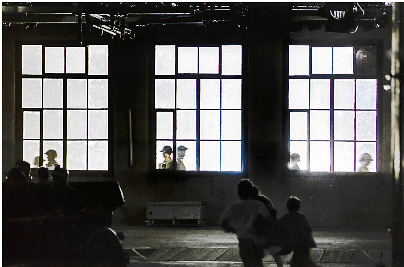
Truppenaufgebot gegen die streikende Arbeiterschaft