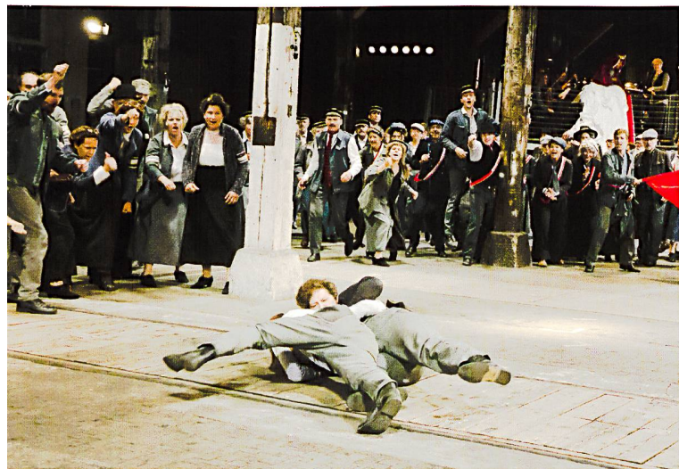
Junger Angehöriger der Bürgerwehr gegen einen organisierten Arbeiter

Entscheid, mit der Schaffung der AHV eine sozialpolitische Wende vorzunehmen. 28 Heutige politische und wirtschaftliche Akteurinnen und Akteure unterschiedlicher Zugehörigkeiten sind sich jedenfalls über die mittel- und langfristigen Auswirkungen des Landesstreiks einig, der als Folge der Eskalation der sozialen Gegensätze eine wichtige Zäsur in der Geschichte der moder-