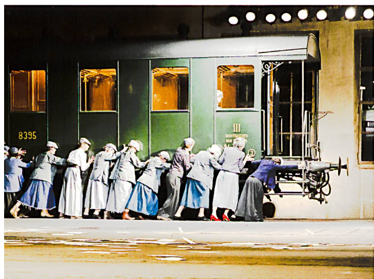
Streikhoffnung Frauenstimmrecht als Zug, der fahren muss

auch in seinem Selbstverständnis als Brückenbauer. Der Bund, alle übrigen Kantone und einige Schweizer Städte beteiligten sich ebenfalls. Einige Stiftungen und Unternehmungen erbrachten finanzielle Unterstützung, ebenso der Arbeitgeberverband und die Gewerkschaften. 25 Wichtige Partner waren die SBB und die Armee. Die breite Unterstützung passt auch zur historischen Einbettung der Folgen des Landesstreiks: Die durch den bedingungslosen Abbruch des Streiks bedingte negative Wertung auf der Seite der Arbeitnehmerschaft überdeckte lange die Erfolge. 26 27 Unmittelbar greifbares Ergebnis war 1919 die massive Verkürzung der Arbeitszeit (48-Stunden-Woche). Zudem veränderten sich die Beziehungen zwischen Arbeitgebern und Arbeitnehmern grundlegend. Die Exportindustrie, von der bisher nur wenige Branchen am Rand mit den Gewerkschaften verhandelt hatten, war nun zu weitgehenden Abkommen bereit. Die Bundesbehörden bezogen die Gewerkschaftsvertreter zunehmend in Entscheidungsprozesse ein. Nicht zuletzt aufgrund der Erfahrung des Landesstreiks waren die Behörden im Zweiten Weltkrieg von Anfang an auf ein Mitwirken der Arbeiterorganisationen an der Kriegswirtschaft bedacht und räumten dem Verteilungsproblem hohe Priorität ein. Auf dieser historischen Einsicht gründeten auch die noch vor Kriegsende geschlossenen Gesamtarbeitsverträge und der ebenfalls während des Kriegs getroffene