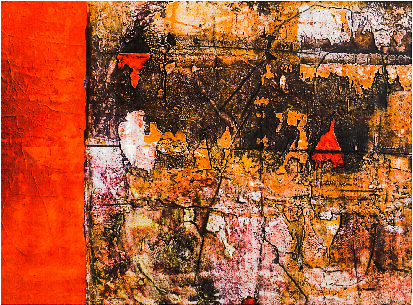
Oben: Ohne Titel, 130 × 100 × 2,5 cm, unten ohne Titel, 34 × 55 × 2 cm

stalten wäre ich nicht mich selber. Auch wenn ich in Südfrankreich bin, kann ich das Malen nicht lassen. Manchmal schleppe ich meine Bilder zum Malen ins Freie, und diese Befindlichkeit des Arbeitens im Freien in einer so wunderschönen Landschaft gibt mir zusätzliche malerische Kraft und Lebensfreude.»