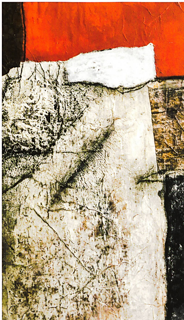
Ohne Titel, 34 × 55 × 2 cm

Magi Stürmlin ist eine höchst engagierte Künstlerpersönlichkeit, die mit Leidenschaft ihrer Malkunst nachgeht. Sie lebt, atmet und denkt für ihre Kunst; beim Gestalten und Malen ist sie hellwach und fühlt sich auf eine besonders vertiefte Art lebendig. Sie beginnt zu malen, oft ohne feste Vorstellung, lässt sich vom Augenblick inspirieren, beobachtet, hinterfragt und arbeitet weiter. Sie malt mit reinen Pigmenten, stellt sämt-