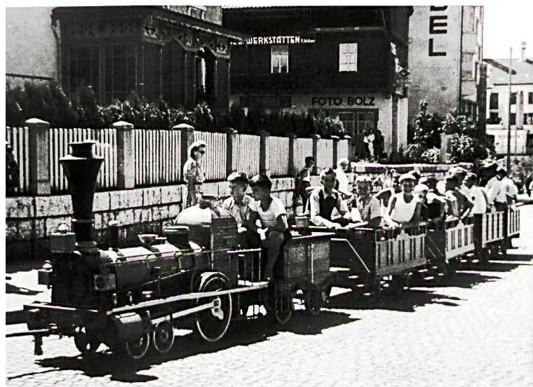
Bevor Foto Bolz das Studio in der Unterführungsstrasse 27 beziehen konnte, befand sich das Atelier neben Möbel Widmer an der Neuhardstrasse (1945–1949).