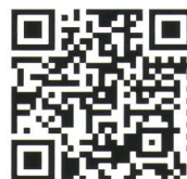
John Stanley Trumpet Tune