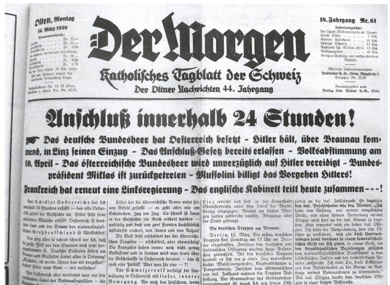
Der Morgen, 14. März 1938

Beim Durchblättern der Oltner Zeitungen fällt auf, wie sehr die weltanschaulich-politische Positionierung der Parteiblätter deren Berichterstattung prägte. Die Redaktion des Volkspartei-Organs «Der Morgen» stand dem christlichsozial-vaterländischen Regime, das in Wien seit 1932 an der Macht war, recht nahe. Der au-