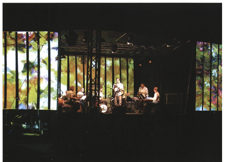
«Zeltkultur» 2013 und «Kulturplatz» 2015