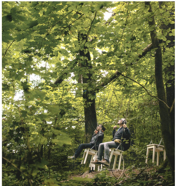
«ch-4656 im Blick» 2017 und «i de Warbighöf» 2019