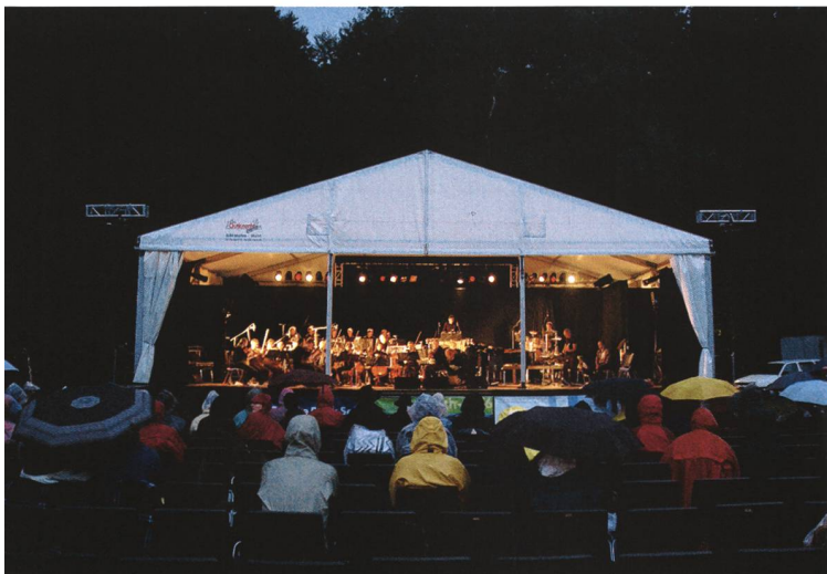
«Skulpturenweg» 2001 und «ch-4656 in concert» 2005