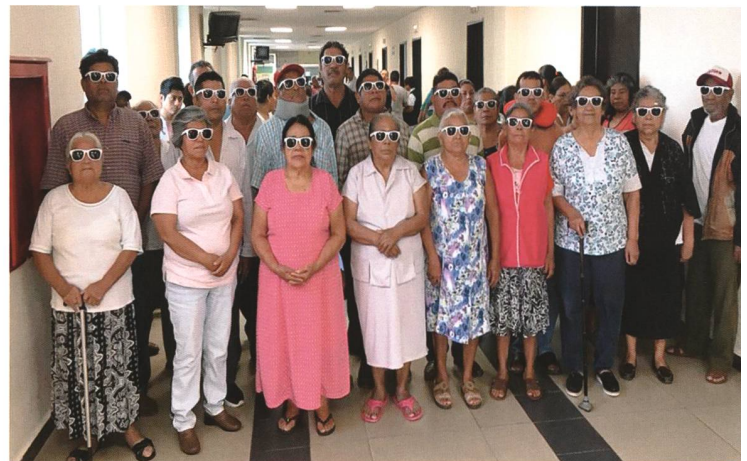
Kataraktpatienten mit Sonnenschutzbrillen in Mexiko

Aufgrund der Coronakrise konnte die Klinik bisher ihr 20-jähriges Jubiläum leider nicht so feiern, wie es Dr. Heuberger und die Mitarbeitenden der Klinik verdient hätten. Die schon geplanten Feierlichkeiten mussten leider kurzfristig abgesagt werden und sollen nächstes Jahr nachgeholt werden. Ein Teil der Feierlichkeiten werden auch Vorträge für das interessierte Publikum sein. Schon jetzt sind Sie herzlich dazu eingeladen!