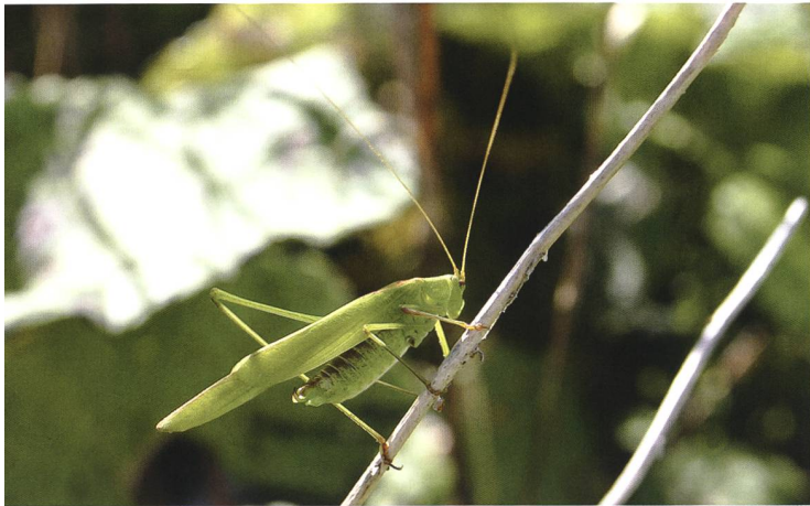
Zielart für Olten SüdWest: Gemeine Sichelschrecke