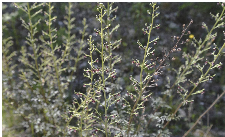
Spezialist 1: Hunds-Braunwurz