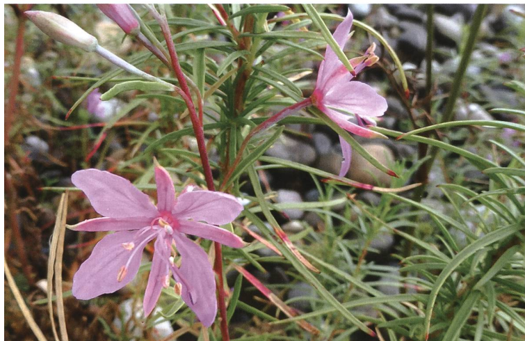
Spezialist 2: Rosmarin-Weidenröschen