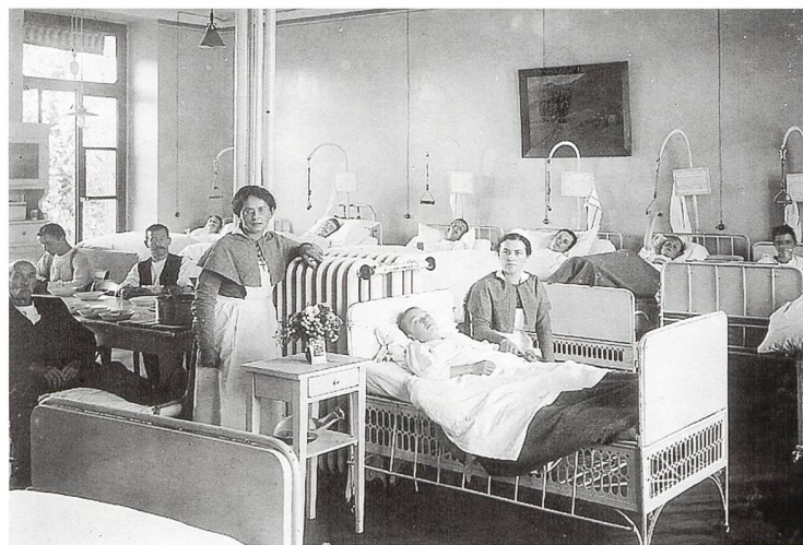
Isolationsstation während der Pandemie der Spanischen Grippe von 1918

«Als junger Mann ist mein Grossvater vor dem 1. Weltkrieg mit einem Fuhrwerk am Kirchrain in Hägendorf verunglückt. Danach lag er wochenlang im Kantonsspital mit Schläuchen im Bauch, aus denen Eiter floss. Neben den Schmerzen war der Durst das Schlimmste. Bei der Chefarztvisite mussten Patienten, die dazu in der Lage waren, im Nachthemd in militärischer Achtungstellung vor den Betten Spalier stehen, was mein Grossvater aber nicht schaffte.»