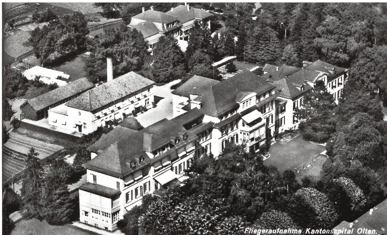
Das Kantonsspital Olten wurde 1880 erbaut und später immer wieder erweitert.