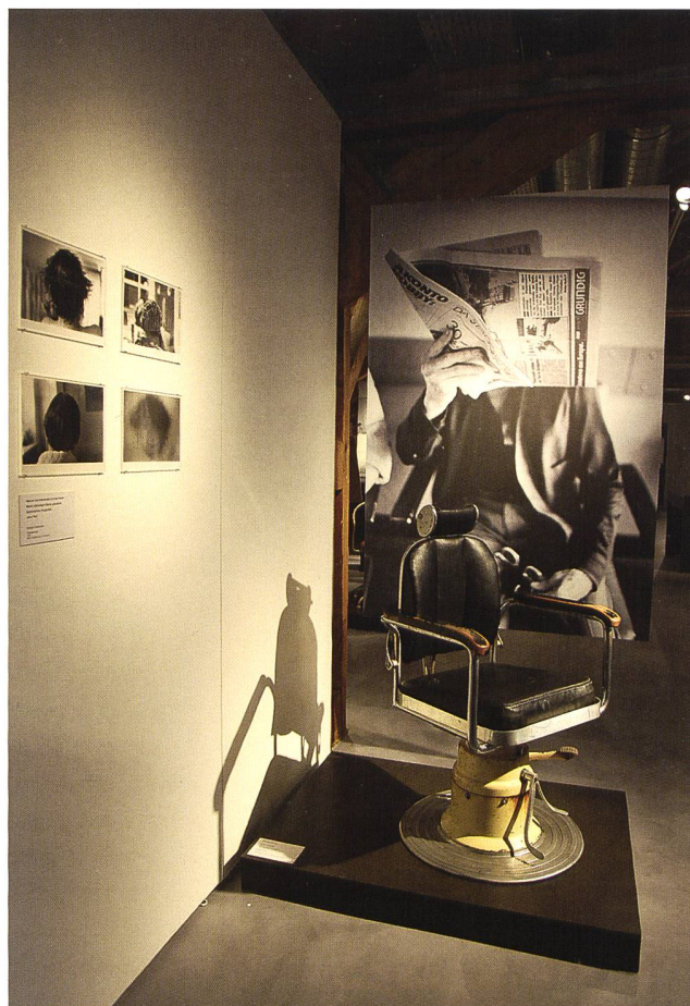
Coiffeurstuhl aus den Beständen der Psychiatrischen Klinik Solothurn, umgeben von Fotografien von Roland Schneider

mit der Eröffnung des neuen Klinikgebäudes (Haus 3) den Patient:innen mehr Freiraum gewährt. Obwohl weiterhin eine geschlossene Abteilung geführt wurde, konnten die Patient:innen teilweise ausserhalb der Klinik einer Arbeit nachgehen. 5