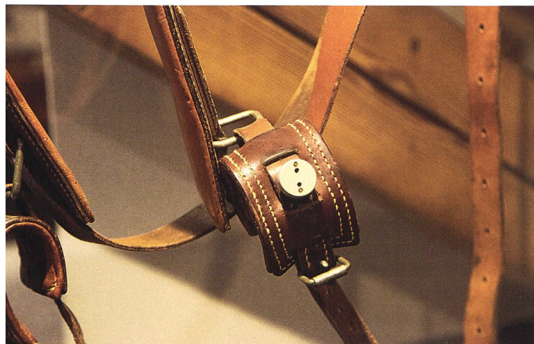
Fixiergurt aus dem Archiv der Psychiatrischen Klinik in Solothurn

1938 die Erwerbung des Landguts «Oberhof» und im selben Jahr die Sanierung der Quellfassung, die zu einem Rückgang der regelmässig auftretenden Typhuserkrankungen in der Anstalt führen wird. 13