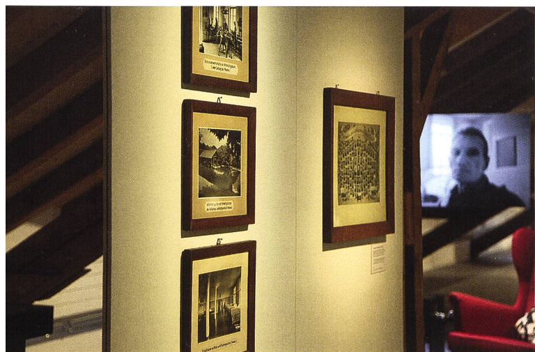
Ausstellungsteil zur Geschichte der Psychiatrie im Kanton Solothurn mit historischen Aufnahmen aus der «Rosegg»

In der Regel war das weibliche Pflegepersonal auch besser ausgebildet, denn bei den männlichen «Wärtern»