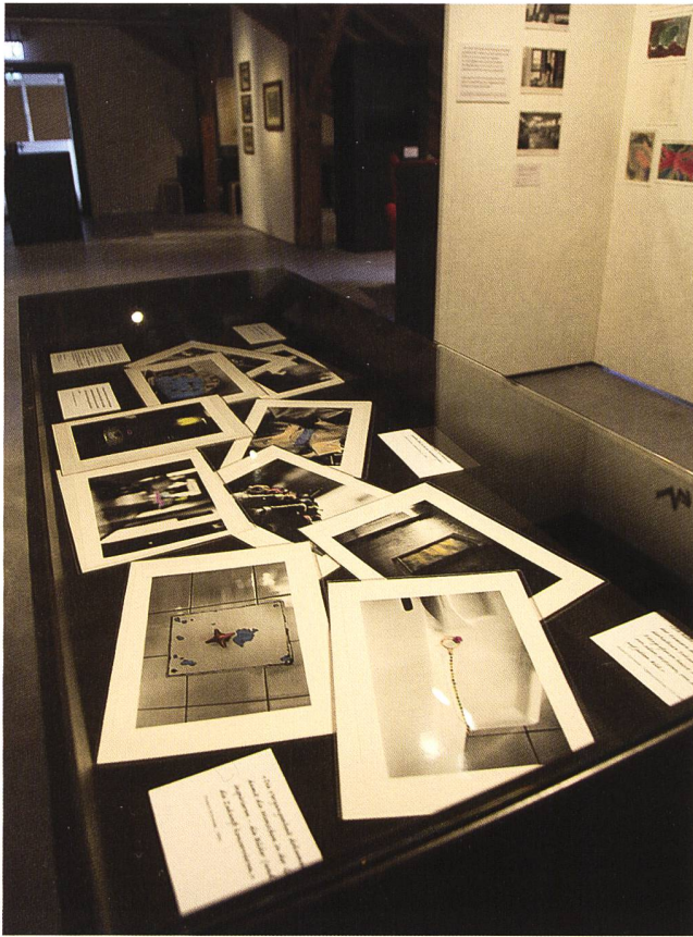
Rekonstruktion von Schneiders «Wühltisch», der dem Publikum bei der Ausstellungseröffnung weitere Fotografien dieser Serie präsentierte

lande gezeigt. An der Vernissage kamen zur grossen Freude Schneiders Patient:innen, interessierte Besuchende und die Belegschaft der Klinik zusammen.