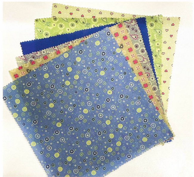
Von BEECOLO hergestellte Frischhalttücher aus recyceltem Stoff und Bienenwachs

Die Zeit war knapp: Nur einen Monat, um einen Stand zu planen, zu gestalten und zu koordinieren. Doch statt sich wegen der knappen Zeit entmutigen zu lassen, zogen wir alle an einem Strang. Dank unzähliger Ideen kamen schliesslich unsere einzigartigen Verkaufsstände zustande. Am Samstag, 1. April 2023, begann die Nationale Handelsmesse. Vom 1. bis zum 5. April durften 75 Unternehmen ihre Produkte präsentieren. Wiederrum standen wir vor einer grossen Herausforderung: Wie sollten wir sicherstellen, dass unser Stand inmitten der geschäftigen Passanten auffallen und die potenzielle Kundschaft anziehen würde? Die Fussgängerinnen und Fussgänger schienen keine Zeit zu haben, um