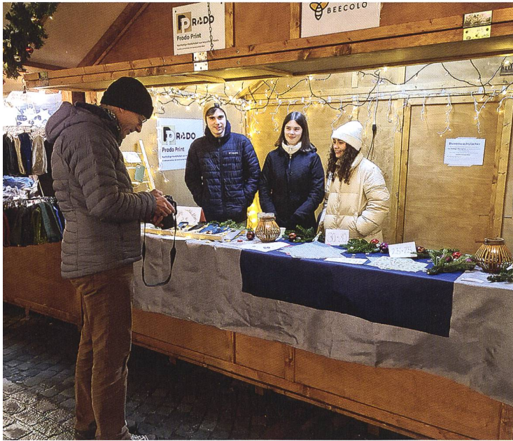
Erste Verkaufserfahrung im Oltner Adventsdorf, Dezember 2022

23 anderen Teams aus der ganzen Schweiz, auszustellen. Verkaufsgespräche, Interviews und sogar eine Bühnenpräsentation standen auf dem Programm. Diese Erfahrung war zweifellos lehrreich und trug dazu bei, unsere Fähigkeiten als angehende Unternehmer und Unternehmerinnen weiterzuentwickeln.