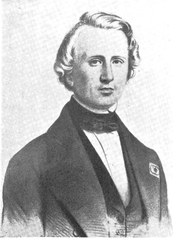
Urbain J. J. Le Verrier