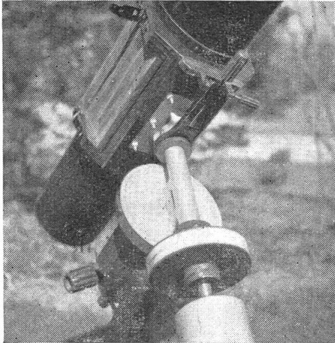
Rohrwiege, Deklinations-Feinbewegung und Teilkreise