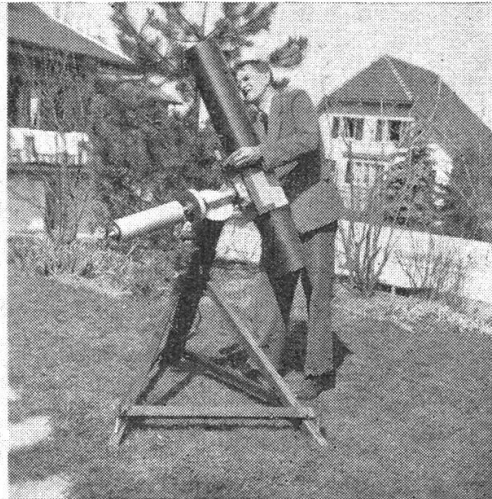
Bedienung der Feinbewegungen

Die Wiege ist aus dreifach verleimtem Sperrholz zusammengesetzt und mit fünf Längsbrettchen ausgesteift.