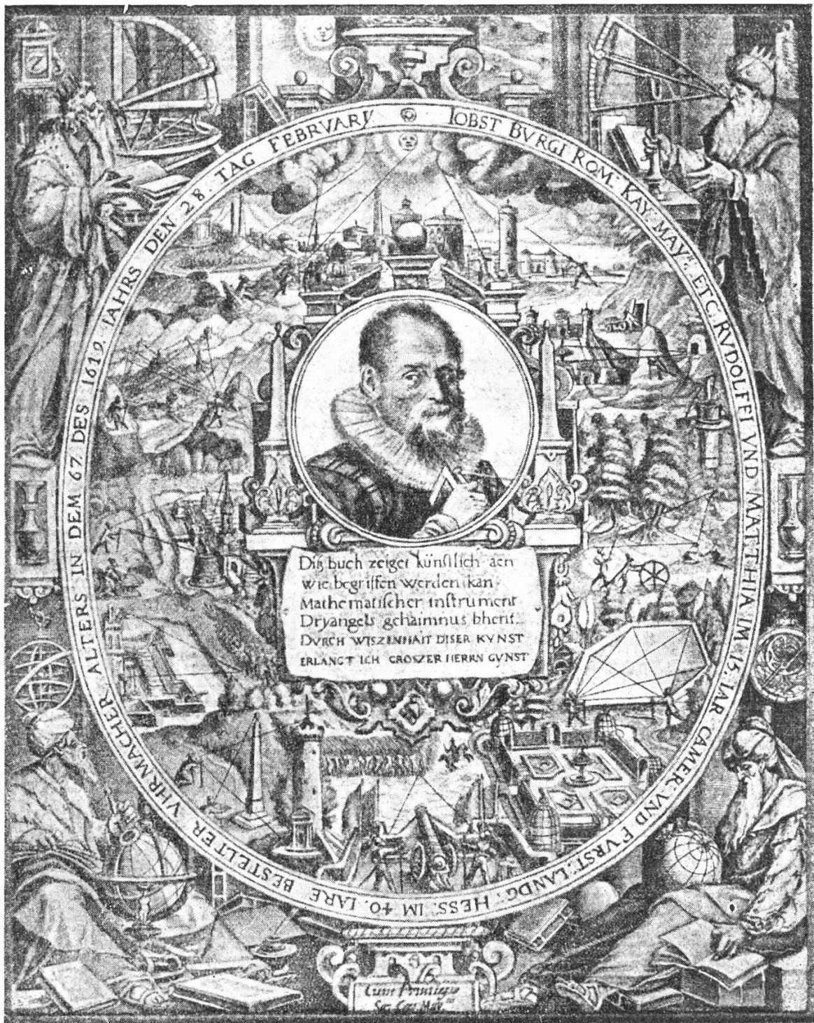
Titelbild zur Gebrauchsanweisung des Triangular-Instruments, mit dem einzigen Bildnis von Bürgi, das er 1619, an seinem 67. Geburtstage, in Kupfer stechen liess. Die Veröffentlichung der Gebrauchsanweisung geschah erst 1648, also 16 Jahre nach dem Tode Bürgis, durch seinen Schwager Benjamin Bramer. (Das seltene Werk befindet sich auch in der Bibliothek des Toggenburger Heimatmuseums in Lichtensteig.)