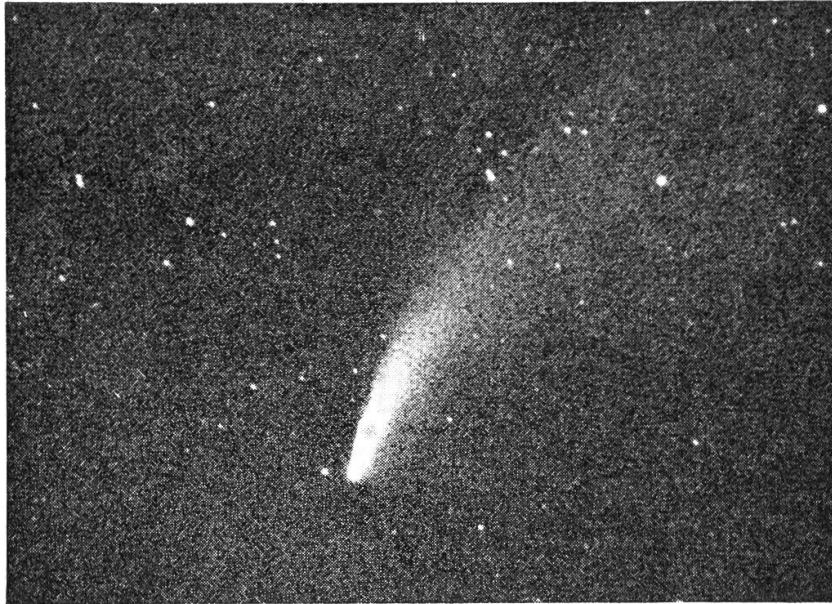
K o m e t M r k o s (1957 d)

mit Tessar 3.5, f = 19 cm, am 14. August 1957, um 21 h 15 m MEZ, Belichtung 8 Min.