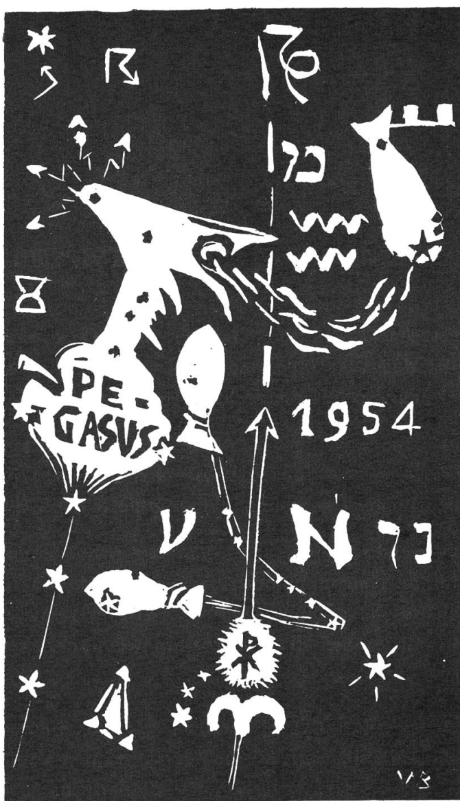
Abbildung 1 - Frühlingspunktverschiebung vom Jahre 1-1954 (Pfeillänge).

Die auffälligsten und wohl auch schon in der Urzeit beobachteten astronomischen Erscheinungen sind der Mondlauf unter den Sternen und damit zusammenhängende Phasenwechsel des Mondes, sowie die Sonnen- und Mondfinsternisse. Für mittlere Breiten, mit ausgeprägten klimatischen Jahreszeiten, ist die Verfolgung des Sonnenlaufs wichtig. Durch Steinsetzungen (wie z. B. in Stonehenge), wird der nördlichste