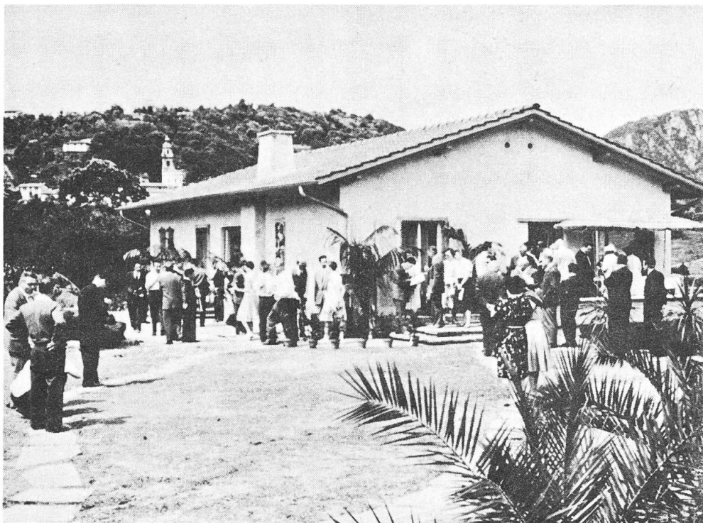
Abbildung 2- Das Ferienhaus der Sternwarte « Calina » von Süden. Die zahlreich versammelten Gäste unterhalten sich am sonnigen Eröffnungstag. Hinten links der Kirchturm von Carona, rechts der Monte San Salvatore, auf dem sich eine Gewitter-Forschungsstation befindet.

Korrektion in AR: a) über Differential-Getrieb elektrisch betätigt, b) Handkorrektur für erste Einstellung.