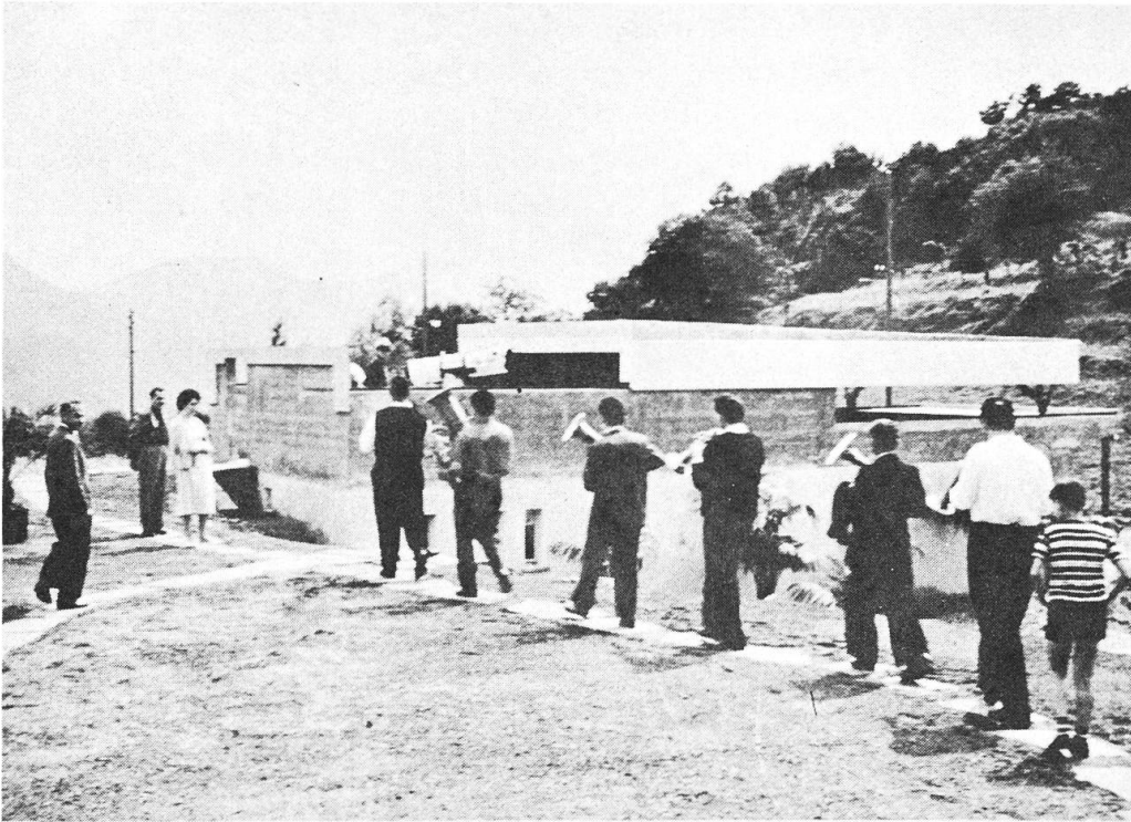
Abbildung 8 - Die geöffnete Sternwarte (abgeschobenes Dach). Man erkennt das Spiegelteleskop. Die Musikantengruppe des Dorfes Carona, die zur Einweihung ein Ständchen brachte, verabschiedet sich.