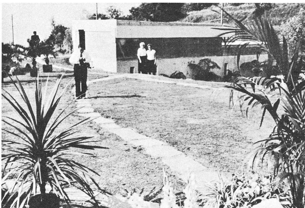
Abbildung 7 - Die Feriensternwarte «Calina» (geschlossen), mit abschiebbarem Flachdach. Im Untergeschoss ist das Photolabor und die Räume mit den Couchetten untergebracht; rechts ist die Garage angebaut.

Wie soll sich nun der Betrieb in diesem Heim für Sternkundige und solche, die es werden wollen, gestalten? Prof. Sauer denkt vorläufig an Ferien-Wochenkurse, die den Teilnehmern eine Einführung in die Himmelskunde ohne besondere mathematische Kenntnisse, gestatten sollen. Diese Kurse werden das Lesen von Sternkarten und die Einstellung und Bedienung von Instrumenten zu lernen ermöglichen. Lehrmodelle, Stern-Atlanten und eine kleine Bibliothek stehen hierfür zur Verfügung. Für Fortgeschrittene wird, als besonderer Zweig, die Pflege der Astro-Photographie eingeführt werden, wozu sich am besten die klaren Herbst- und Winternächte eignen. Für diese vorgesehenen Kurse sollten sich Interessenten schon heute vormerken lassen, um das Problem der Unterkunftsmöglichkeiten zeitig genug abzuklären; die Angemeldeten werden dann ausführliche Programme zugesandt erhalten. Geplant sind weitere Kurse, für die sich wissenschaftlich gebildete Astronomen zur Verfügung stellen werden. Auch Jugend- und Studentenkurse, sowie eigene Kurse und Gemeinschaftsarbeiten der einzelnen Arbeitsgruppen der SAG, sind durchführbar; sie müssen aber, in Vereinbarung mit der Ferien-Sternwarte, rechtzeitig gemeldet und geplant werden. Die Sternwarte bleibt auch jeweils für die Tage über Weihnachten und Neujahr offen, worauf besonders hingewiesen sei!