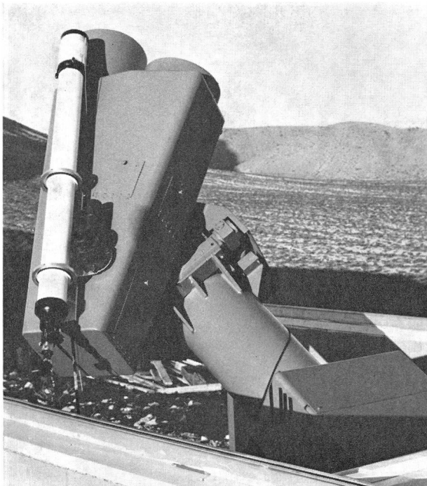
Abb. 2: Der Prototyp der Reflexions-Schmidt-Kamera auf dem Corralitos Observatory. Das Leitrohr liegt parallel zum einfallenden Strahlenbündel, der Korrektionspiegel befindet sich unten, der Hauptspiegel rechts oben.

Art ersetzen, auf dem aber Rillen eingeritzt sind. Es ist beabsichtigt, ein Gitter von 100 Linien pro mm auf einer Fläche von 112.5 Millimeter im Quadrat herzustellen, womit man bei einer reziproken Dispersion von 200 \text{ \AA}/\text{mm} eine Auflösung von 3.4 \text{ \AA} erwarten könnte. Werden der normale Korrektionspiegel und der Gitterspiegel in der gleichen Fassung mit den Rückseiten gegeneinander gebracht, so ist durch einfache Drehung um 180 \text{ Grad} die Umstellung von direkten Aufnahmen zu Spektralaufnahmen leicht durchzuführen, und solche einfachen Handhabungen sind bei Observatorien auf Raumfahrzeugen besonders erwünscht.