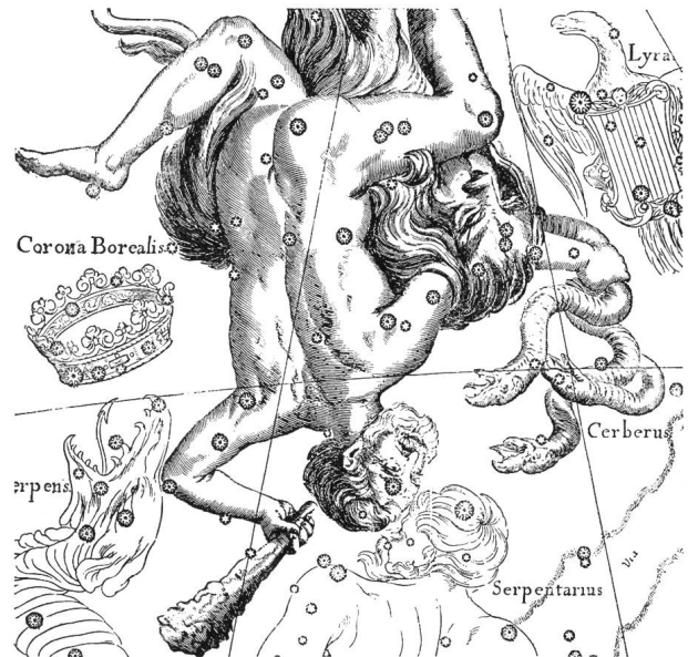
Herkules nach HEVELIUS, 1660 (FLAMMARION, Fig. 155)

Alle: EUDOXUS, ARATUS, ERATOSTHENES, HIPPARCHOS, PTOLEMAEUS und andere nennen ihn den Knienden. Ich finde zum ersten Mal und zu meinem grossen Erstaunen den Namen Herkules in der Ausgabe des HYGINUS, von der ich vorher gesprochen habe (1485), und noch ist er hier mit dem anderen Namen «Engonasi, Herkules» verbunden. Im Katalog von TYCHO BRAHE (1590) trägt diese Figur gleichfalls die beiden Namen. Der Name Herkules ist also eine verhältnismässig moderne Benennung.