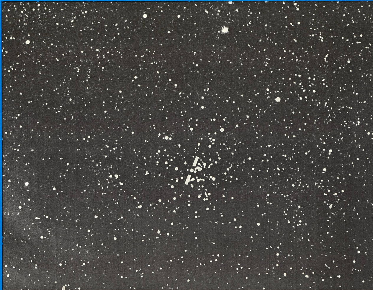
Offener Sternhaufe M 25 mit Cepheide U Sagittarii (markiert), Nord oben. Aufnahme von J. Lienhard mit Schmidt-Kamera \varnothing = 250 mm, f = 400 mm, 20 Minuten auf Kodak-TRI-X-Ortho. Siehe auch Artikel auf Seiten 53/54 dieses Heftes.

Zeitschrift der Schweizerischen Astronomischen Gesellschaft Bulletin de la Société Astronomique de Suisse