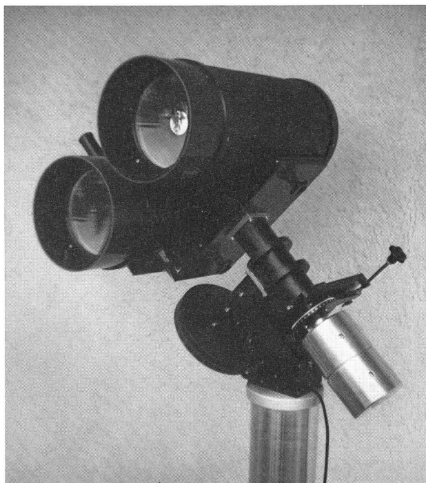
MAKSUTOW-Doppel-Teleskop 200/500 mm und 3200 mm

Beratung und Vorführung gerne und unverbindlich!