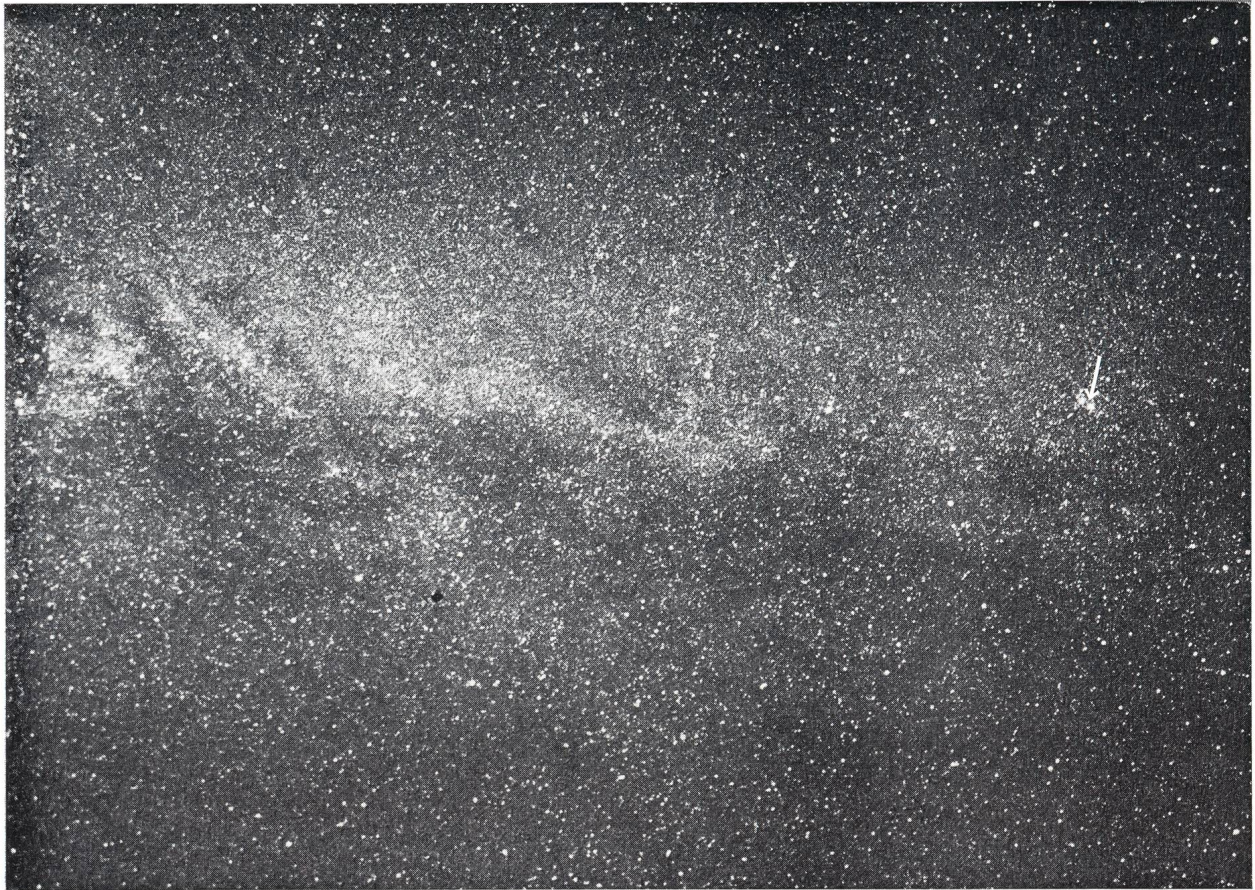
Fig. 2: Übersichtsaufnahme der nördlichen Milchstrasse von \delta und \zeta Persei bis über Lyra hinaus. f=21 mm, Kodak 103 aG-Film, 30 Minuten belichtet. 15. 9. 1972.