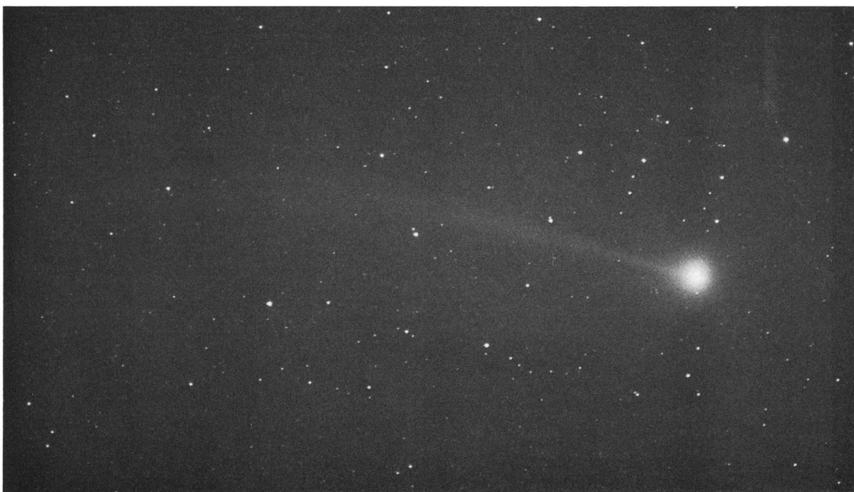
Bild 3: am 4. 8. 1975, 21^{\text{h}}45-22^{\text{h}}00, mit Kleinbild-Objektiv 500 mm 1:4.5, Kodak Tri-X-Film. Schweif ca 7^{\circ} lang, Helligkeit ca. 4,5^{\text{m}}_{\text{vis}}. Norden ist oben.