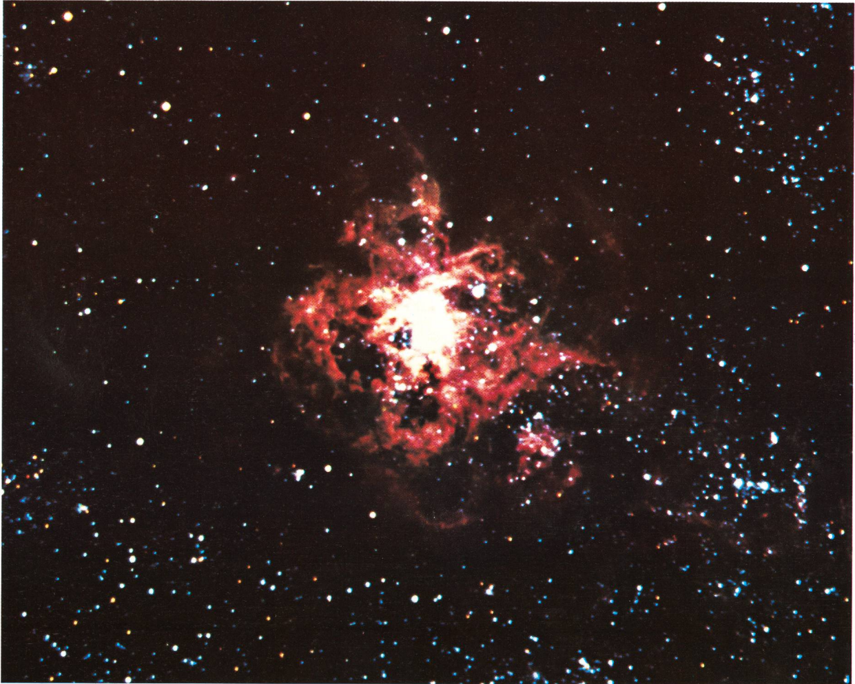
Abb. 1: Tarantelnebel NGC 2070 in der Grossen Magellanschen Wolke. Aufnahme mit 20 cm-NEWTON. Belichtungszeiten: Blau: 40 Min., Grün: 38 Min., Rot: 50 Min.

VON ECKHARD ALT, ERNST BRODKORB, REINHARD MEHRMANN UND KURT RIHM