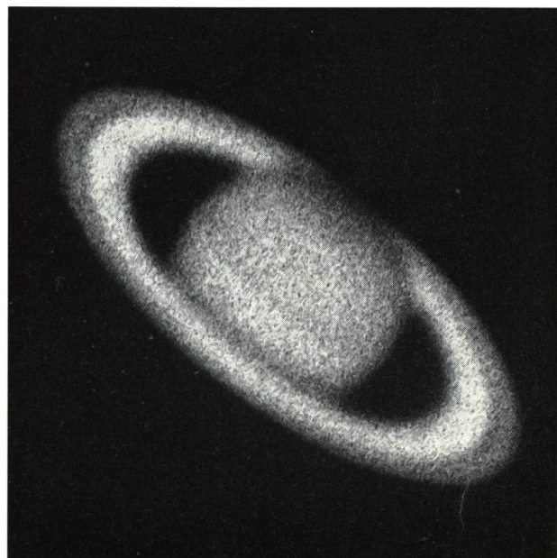
Fig. 2: Photographie de Saturne, compositée à l'aide de sept négatifs.