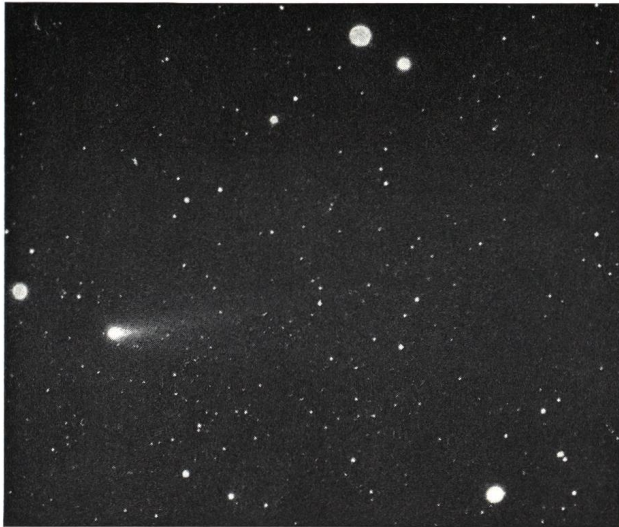
Aufnahme: 9. April 1976, 04 h 48 m MEZ. Schweiflänge: 2°.