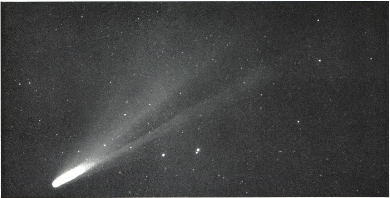
Aufnahme: M. BRUNOLD, 11. März 1976, 05 h 00 m MEZ. Kamera: Nachgeführte Kleinbildkamera mit 135 mm Objektiv, f/2,8. Belichtungszeit: 60 Sekunden auf Kodak Tri-X.

Nach längerem Passen gelangen mir diese drei Aufnahmen am Morgen des 11. März in Oberägeri, Rattenpass, auf ca. 1100 m Höhe, bei relativ guten Sichtbedingungen knapp über der Dunstgrenze.