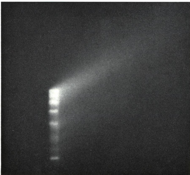
Fokussierung auf den blauen Spektralbereich.

Durch fünfmaliges Übereinanderbelichten wurde die totale Belichtungszeit auf drei Minuten ausgedehnt. Die beiden Aufnahmen zeigen deutlich die breiten, ausgeprägten Emissionen des Kometenkopf-Spektrums.