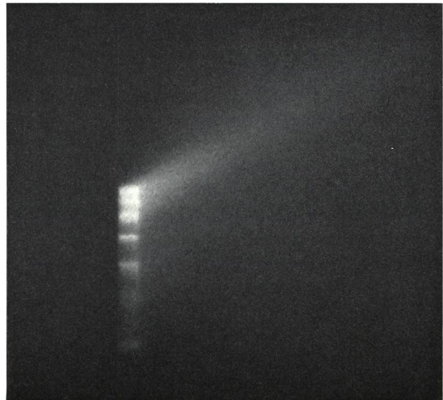
Fokussierung auf den roten Spektralbereich.