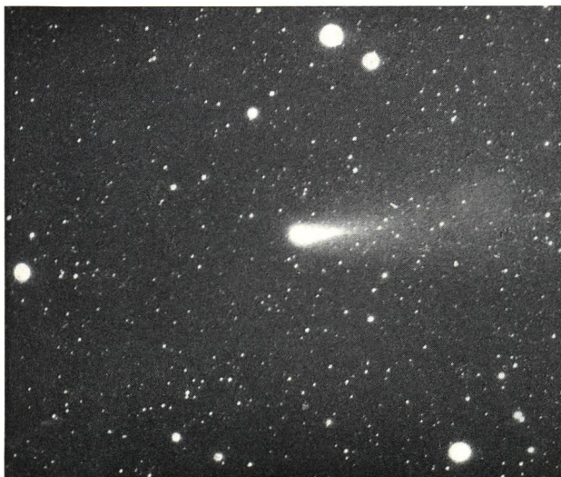
Aufnahme: 11. April 1976, 04 h 33 m MEZ. Schweiflänge: 1,5°.