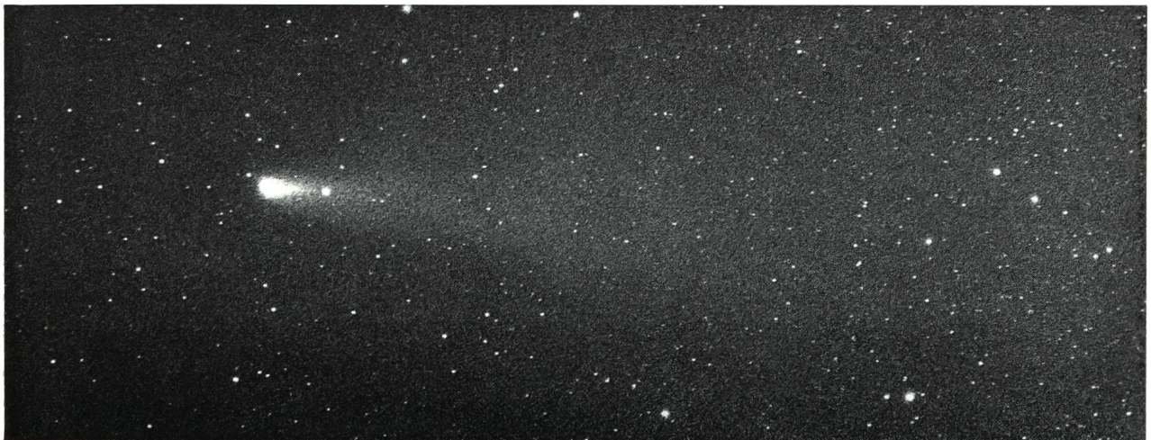
Aufnahme : 2. April 1976, 04 h 48 m MEZ. Schweiflänge: 3°.