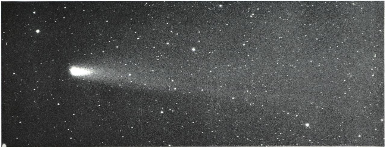
Aufnahme : 30. März 1976, 05 h 12 m MEZ. Schweiflänge: 5°.

nommen. Auf den ersten sechs Aufnahmen kann man sehr gut die Bahn des Kometen durch das Sternbild Delphin verfolgen.