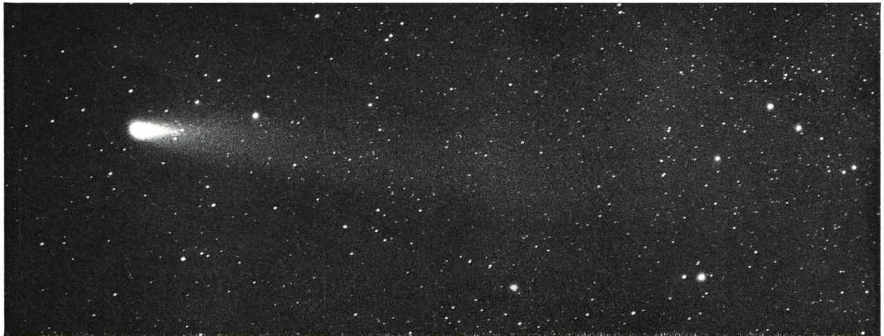
Aufnahme : 1. April 1976, 05 h 10 m MEZ. Schweiflänge: 5°.