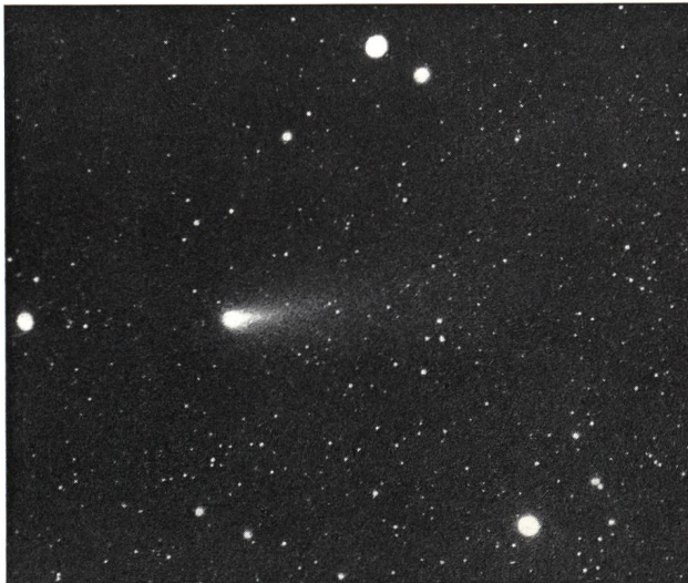
Aufnahme: 10. April 1976, 04 h 44 m MEZ. Schweiflänge: 2°.