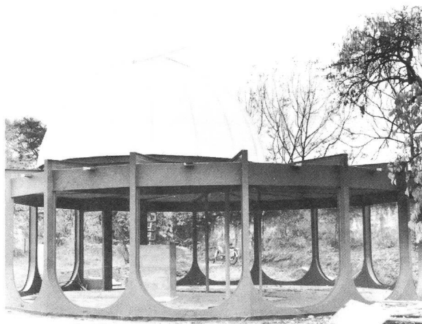
Fig. 1: L'Observatoire du Haut-Léman en construction (état à mi-novembre 1976).

D'autre part, nous avons entrepris le polissage d'un miroir de 30 cm, maintenant terminé et d'un secondaire CASSEGRAIN en cours de réalisation. Ceci constituera l'instrument principal de l'observatoire qui sera fixé sur la table équatoriale de la monture du