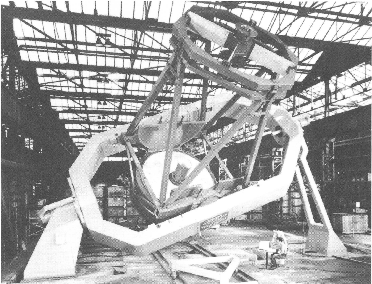
Blick auf das in Grossbritannien im Bau befindliche Infrarot-Teleskop, das im Lauf des Jahres 1978 auf dem über 4000 m hohen Gipfel des erloschenen Vulkans Mauna Kea in Hawaii in Betrieb genommen wird.