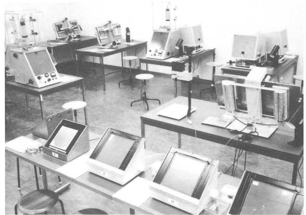
Grosser Praktikumsraum mit im eigenen Institut entwickelten Übungsinstrumenten. Diese Instrumente werden auch von andern Sternwarten geschätzt und können, oft im Austausch gegen Beobachtungsmaterial, an sie abgegeben werden.

Und darf man wohl — in einem Satz wenigstens — darauf hinweisen, dass astronomisches Wissen einen fundamentalen Teil unseres Bildes vom Menschen und seiner Stellung im Kosmos zum Inhalt hat? Das löst ein Potential an Interesse aus, das weit über den Kreis der Studenten in den Naturwissenschaften, ja in der Universität hinausgreift. Wohl darum auch übersteigen die laufend eingehenden, oft dringenden Anfragen für Volkshochschulkurse, Führungen, Vorträge jeder Art die Leistungsgrenzen der Dozenten dieses Gebietes. Kaum ein Fachgebiet zeigt ein solches Missverhältnis zwischen kleinem Personalbestand und umfangreichem Informationsbedürfnis der Allgemeinheit und damit