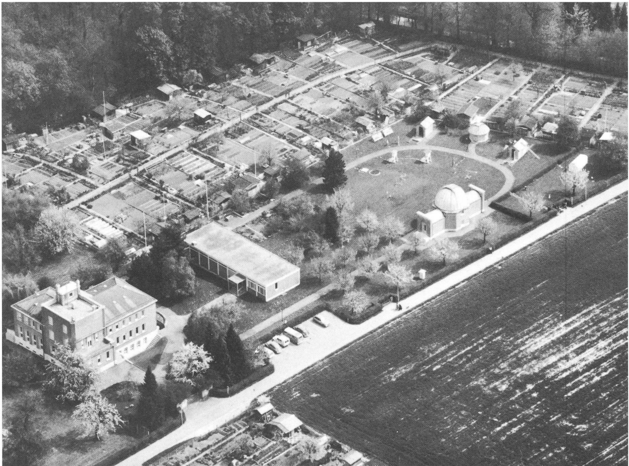
Das Astronomische Institut der Universität in Binningen. Von links nach rechts: Hauptgebäude mit Arbeitsräumen, Bibliothek und Werkstatt, Pavillon mit Seminar- und Praktikumsräumen und dem Büro der Abteilung für Meteorologie, grosser Kuppelbau, darüber Feld mit den meteorologischen Instrumenten und drei kleinen Bauten für Übungsteleskope.

Weltraumprojekte und ihre neuen Erkenntnisse haben Sterne und Planeten zum Thema selbst der Tagespresse und Fernseh-Aktualitäten gemacht. Die Faszina-