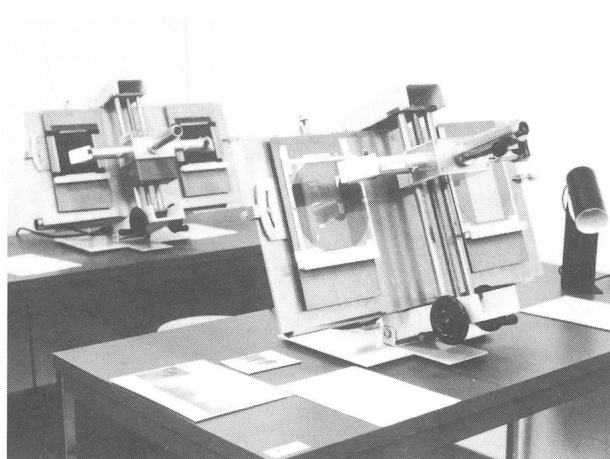
Zwei Plattenkomparatoren (Übungsinstrumente) zur gleichzeitigen Betrachtung von zwei Aufnahmen des gleichen Himmelsfeldes (zum raschen Auffinden und Vermessen von Änderungen in der Position oder Helligkeit einzelner Sterne, von Helligkeitsunterschieden auf Aufnahmen in verschiedenen Spektralbereichen etc.).