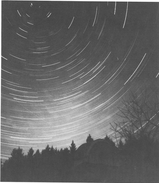
Zircum-Polaraufnahme an der Sternwarte Violau.

konnten, sowie auf die Zugspitze, mit 2963 m ü. M. der höchste Berg Deutschlands: Ein Erlebnis für Leute aus flachen Ländern wie den Niederlanden oder Ägypten.