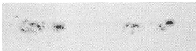
Grosse Fleckengruppe am 10. November 1979. Deutlich sind bereits Veränderungen in der Form der einzelnen Flecken zu beobachten. Grössere und kleinere Lichtbrücken sind leicht auszumachen.