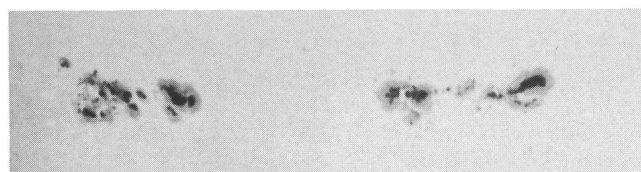
Grosse Fleckengruppe am 9. November 1979.