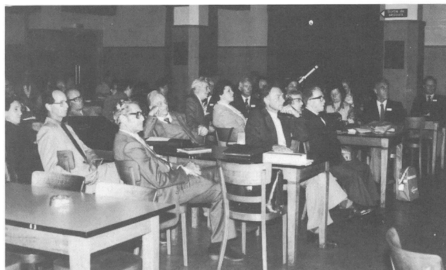
Die aufmerksame Zuhörerschaft im Maison du Peuple.

der Universitätssternwarten von Zürich und Locarno, mit ihren unerfreulichen Folgen hinweisen musste. Es folgte die speditive Abwicklung der Traktanden mit Jahresberichten, Rechnungsablagen und Budget mit unveränderten Jahresbeiträgen für 1981, sowie die Bestimmung von Solothurn für die nächste GV und zwar am 20. und 21. Juni 1981. Nach Schluss der GV fuhren die Teilnehmer mit einem Bus zum Doubs, der auf lange Strecken die Grenze zu Frankreich bildet. Bei Les Brenets bestieg man ein Motorboot, das über den durch eine natürliche Felsbarriere gestauten See in die Nähe des imposanten Wasserfalles fuhr. Nach kurzem Marsch dem romantischen Seeufer entlang, bewunderten wir das Naturschauspiel des 25 m hohen, gewaltigen und stiebenden Wasserfalles. Zurückgekehrt erlabten wir uns an einem malerisch angelegten und reichhaltigen Buffet und kamen dann noch in den Genuss der «Diasynfonie» von Herrn Robert Phildius aus Genf: «La clé sur la porte». Diese audio-visuelle Vorführung verdient wahrlich die Bezeichnung «Spectacle», folgten doch in atemberaubendem Tempo wohl hunderte von meisterhaften Astro-dias, gemischt mit eindrucksvollen Naturaufnahmen und alles mit kaum zu überbietenden Geräusch- und Tonkombinationen begleitet.