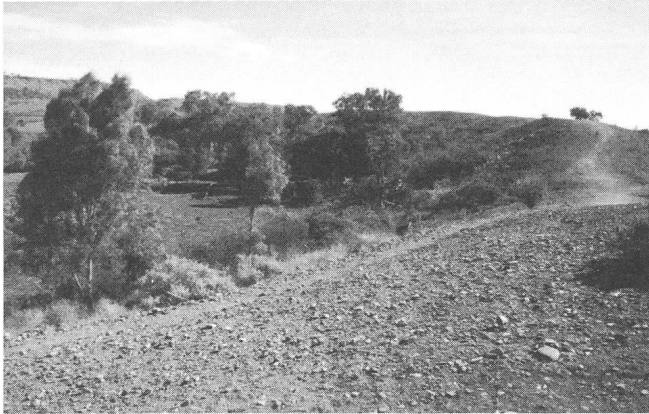
Abb. 2. Im Gegensatz zur umliegenden Landschaft wachsen auf dem Kraterboden mehr Sträucher und sogar einige Bäume.

Die Ausmasse der fünf grössten Henbury-Krater. Zum Vergleich sind auch die Masse des berühmten Meteoriten-Kraters in Arizona aufgeführt. Die Höhe gibt an, wie weit sich der Kraterstand über die umliegende Ebene erhebt. Die Tiefe ist jeweils vom Kraterstand aus gemessen.