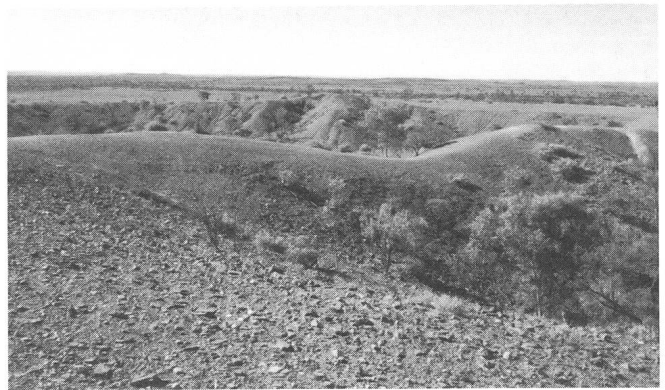
Abb. 3. Vorne rechts senkt sich der zweitgrösste Krater C ab, während im Hintergrund ein Teil von Krater A zu erkennen ist.

Australian Museum in Adelaide und im Smithsonian Institute in Washington D.C. sind Teile dieses Objektes ausgestellt.