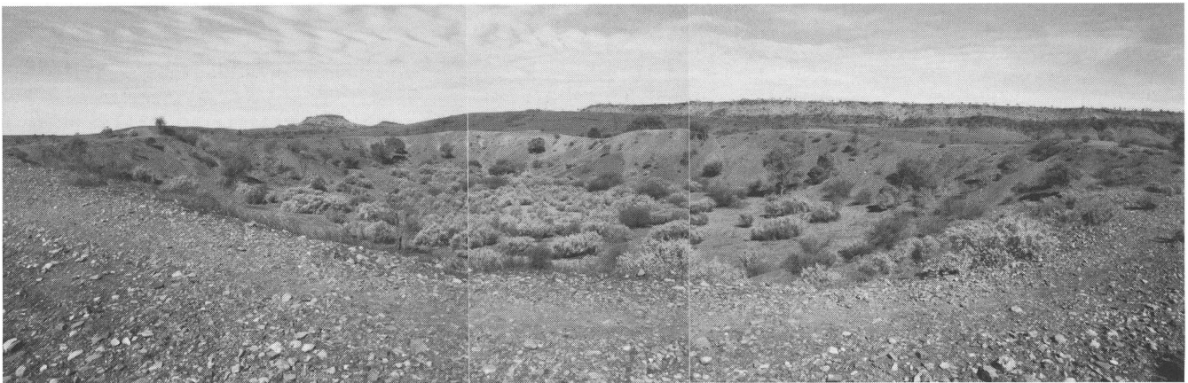
Abb. 1. Blick von Nordwesten her in den grössten Henbury-Krater (A).

gewaltigen Meteoritenfalls – die sogenannten Henbury-Krater mit Durchmessern von 6 bis 183 Metern – lassen sich noch heute besichtigen. Die australische Regierung hat an dieser Stelle ein Gebiet von 16 Hektaren zu einem kleinen Nationalpark erklärt, in dem 9 der insgesamt 13 Krater enthalten sind. Obwohl sie mitten in einer von Touristen vielbesuchten Gegend Australiens liegen, wird ihnen eigentlich wenig Beachtung geschenkt. Dabei sind die Henbury-Krater problemlos zu finden und auch leicht erreichbar (ausser nach heftigen Regenfällen). Auf der Fahrt von Alice Springs – der einzigen grösseren Ortschaft im Herzen des Kontinents – zum berühmten Ayers Rock lohnt sich deshalb auf alle Fälle ein Abstecher zu den Kratern. 136 km südlich von Alice Springs verlässt man dazu den Stuart Highway, der die Stadt Darwin am nördlichen Ende